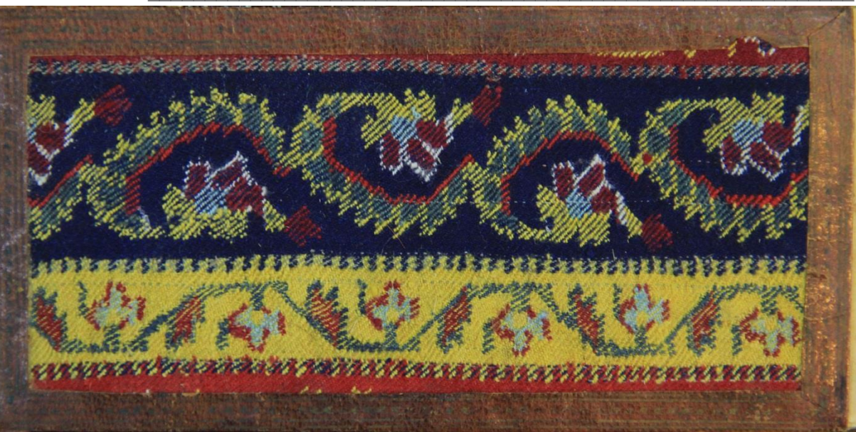
تصویر ۴: جلدیاض بارو کش پارچه ودور وعطف تبماج نسخه خطی به شماره ۱۱۱۸۳ کتابخانه مرکزی دانشگاه تهران.