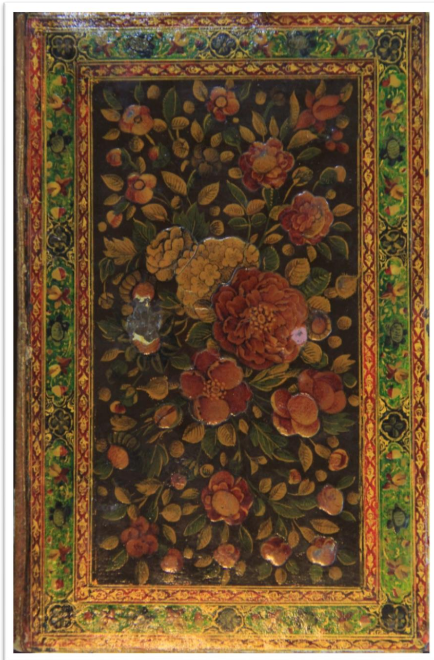
تصویر ۵: جلد روغنی گل و بوته

نسخه خطی به نام قرآن به شماره ۴۹۳۱ کتابخانه مرکزی دانشگاه تهران