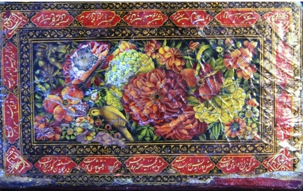
تصویر ۲- نسخه خطی به شماره ۴۷۳۱ مرکزی به نام جنات الوصال جلد روغنی آراسته با گل و بوته و پرندۀ به رنگهای سبز آبی و زر در حاشیه شعرهایست درستایش این کتاب

شماره ۱۰۸۹۶ کتابخانه مرکزی دانشگاه تهران جلد روغنی دورو، با ترنج و سرترنج ولچکی و جدول، با کتیبه دورتاروران درون کتیبه غزلی از حافظ نوشته شده است.