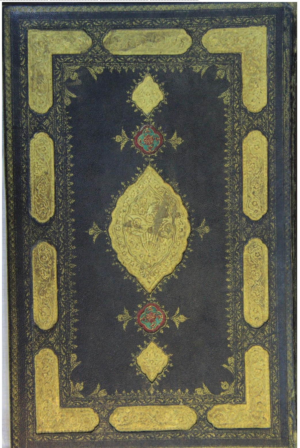
تصویر ۳. جلد سوخت وزر کوب نسخه خطی بنام خمسه نظامی به شماره ۹۸ کتابخانه مرکزی دانشگاه تهران.