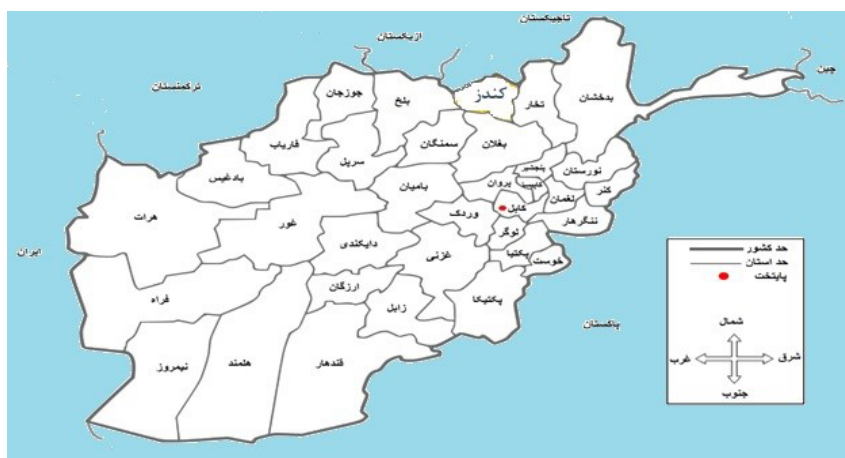
فصلنامه پژوهش‌های روستایی

برای تجزیه و تحلیل اطلاعات علاوه بر آماره‌های توصیفی نظیر میانگین، انحراف معیار و ضریب تغییرات، از تحلیل عاملی تأییدی (روش مدل‌سازی معادلات ساختاری بر پایه روش حداقل مربعات جزئی) به کار گرفته شد. از ضریب تغییرات برای اولویت‌بندی گویه‌های مطرح شده از سوی پاسخگویان استفاده شد. لازم به توضیح است که تحلیل عاملی روش هم وابسته بوده که در آن کلیه متغیرها به‌طور همزمان مدنظر قرار می‌گیرند (Kalantari, 2018). در نتیجه، از آنجا که در دنیای واقعی معمولاً تمامی عوامل و متغیرهای تأثیرگذار بر یک پدیده در کنار هم بوده و مستقل از هم عمل نمی‌کنند، برای شناسایی مؤثرترین عوامل و متغیرها از روش تحلیل عاملی تأییدی استفاده شد. مبنای تجزیه و تحلیل