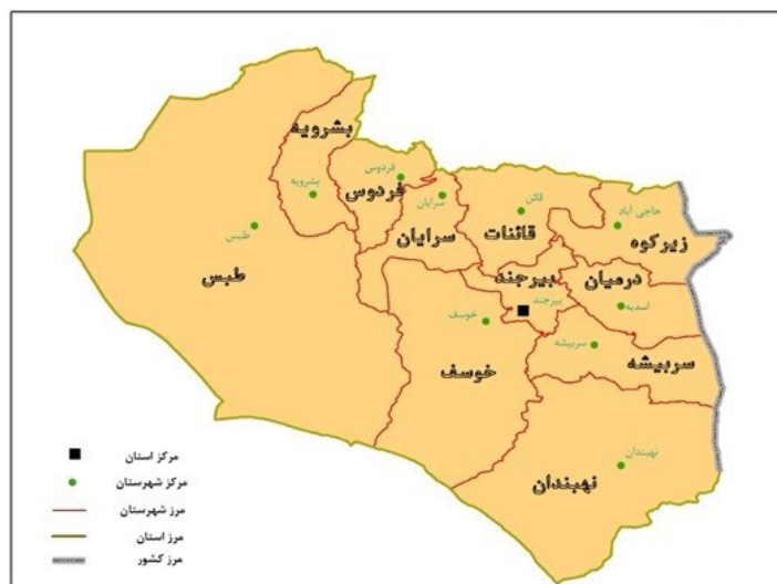
تصویر ۲. نقشه تقسیمات سیاسی استان خراسان جنوبی.

استان خراسان جنوبی در شرق ایران و حاشیه شمال شرقی دشت لوت قرار دارد و مرکز آن شهر بیرجند است. این استان با ۹/۱۴ درصد از وسعت کشور (۱۵۱۱۹۳ کیلومترمربع)، سومین استان وسیع کشور محسوب می‌شود. استان خراسان جنوبی، با مصوبه مجلس شورای اسلامی و پس از تقسیم استان خراسان به سه استان، در سال ۱۳۸۲ ایجاد شد. بر اساس سرشماری سال ۱۳۹۵، جمعیت آن برابر با ۷۶۸۸۹۸ نفر است، که از این نظر بیست و هشتمین استان کشور شناخته می‌شود و دارای ۱۱ شهرستان، ۲۵ بخش، ۶۱ دهستان و ۲۸ شهر است. از کل جمعیت استان، ۵۹/۰۲ درصد در سکونتگاه‌های شهری و ۴۰/۹۸ درصد در سکونتگاه‌های روستایی زندگی می‌کنند. شهرستان بیرجند با ۲۶۱۳۲۴ نفر پرجمعیت‌ترین شهرستان استان و مرکز آن است (تصویر شماره ۲). در سال ۱۳۹۵ خراسان جنوبی از ۳۲۲۷ آبادی برخوردار بوده است. از این تعداد فقط ۱۷۸۱ مورد شامل آبادی‌های تخلیه‌شده از جمعیت و ۱۴۴۶ مورد شامل آبادی‌های دارای جمعیت هستند. بنابراین ۵۵/۲ درصد از آبادی‌های موجود در خراسان جنوبی فاقد جمعیت گزارش شده‌اند و تنها ۴۴/۸ درصد از آن‌ها از جمعیت ساکن برخوردارند. قابل توجه است که، از کل روستاهای دارای جمعیت، ۱۳۱۱ سکونتگاه برابر با ۹۱ درصد از آن‌ها، کمتر از ۵۰۰ نفر جمعیت دارند و تنها ۴۶/۴ درصد از کل جمعیت روستایی استان را در خود اسکان داده‌اند (Statistical Centre of Iran, 2016). این وضعیت گویای شکنندگی و آسیب‌پذیری نواحی روستایی استان در برابر مهاجرت بی‌رویه