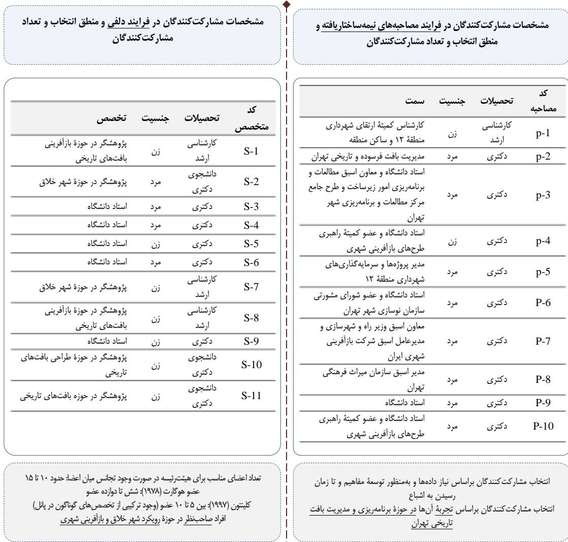
شکل ۳. مشخصات مشارکت‌کنندگان در فرایند پژوهش

در شکل ۴ نیز فرایند پژوهش به اختصار نشان داده شده است.