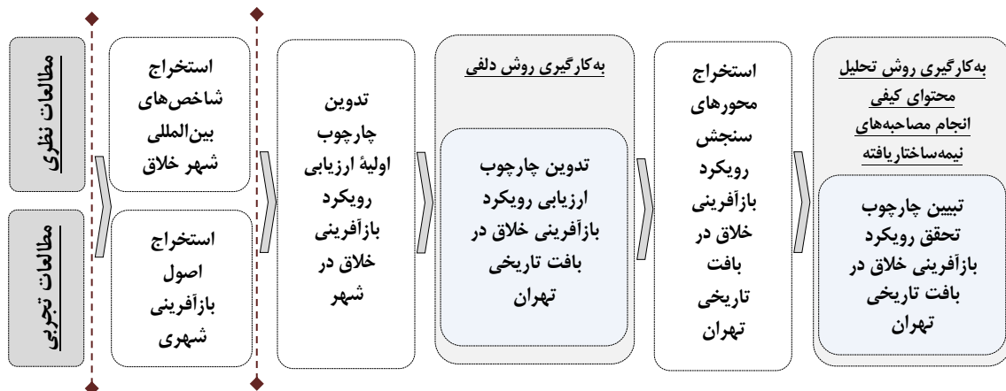
شکل ۴. فرایند پژوهش

در شکل ۴ نیز فرایند پژوهش به اختصار نشان داده شده است.