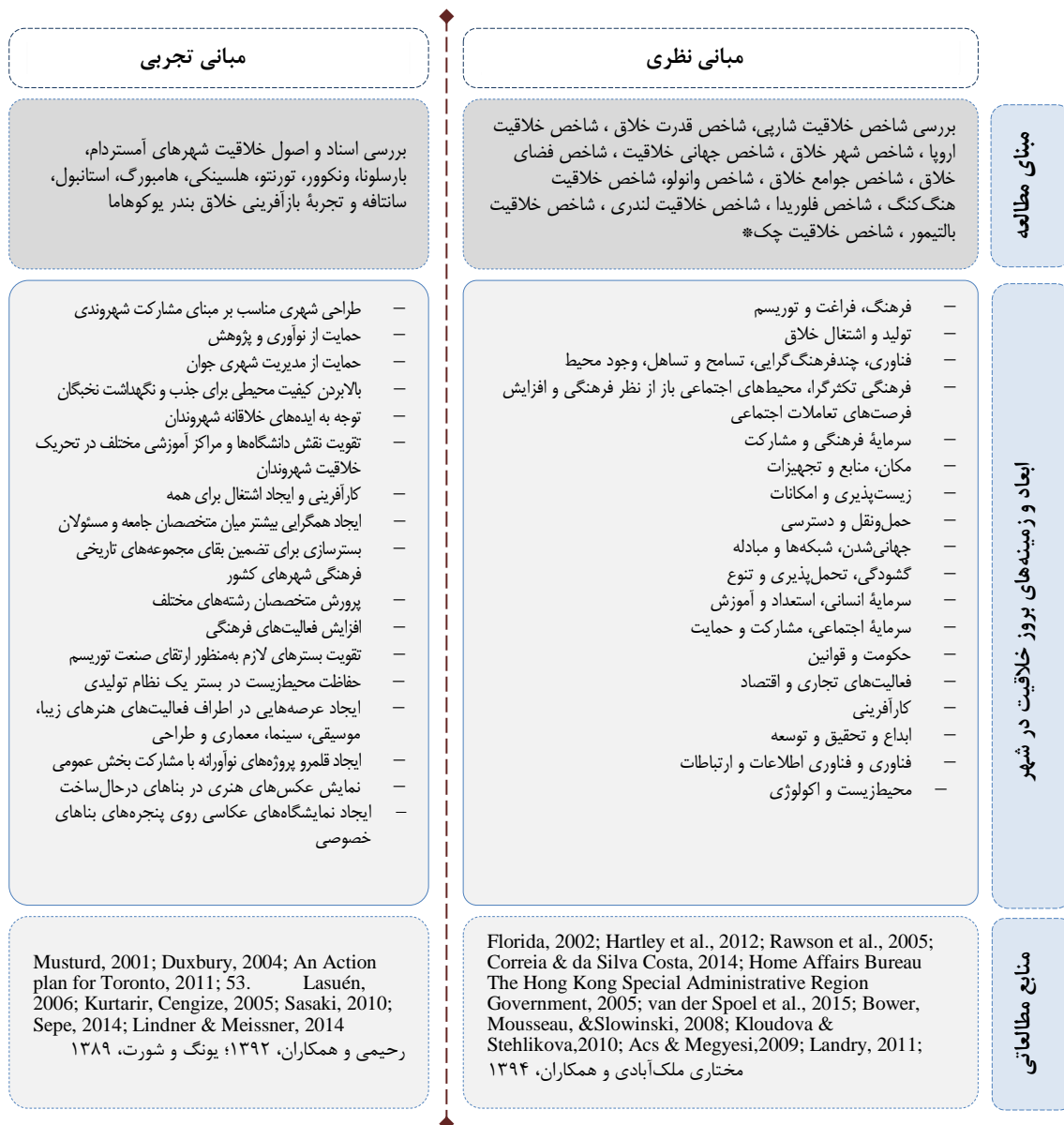
شکل ۱. ابعاد و زمینه‌های شاخص‌های بین‌المللی شهر خلاق و مبانی تجربی این رویکرد

در راستای ارائه چارچوب ارزیابی رویکرد بازآفرینی خلاق بافت تاریخی تهران و تبیین چارچوب تحقق‌پذیری این رویکرد که هدف اصلی مقاله است، ابتدا شاخص‌های بین‌المللی برگرفته از مطالعات نظری پیشین و همچنین تجربه‌های مرتبط با این رویکرد و آموزه‌های قابل‌به‌کارگیری از آن‌ها بررسی شد که نتایج آن در شکل ۱ آمده است.