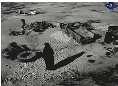
تصویر ۳- اپیزود دوم فیلم پری.