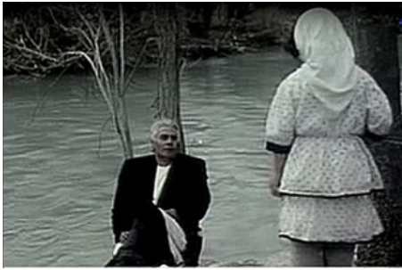
تصویر ۴- اپیزود ششم فیلم پری.

تحلیل فرایند اقتباس در فیلم (پری) داریوش مهرجویی با استفاده از الگوی روایت‌شناسی کنشگر گرماس و الگوی تحلیل ساختاری فیلم بوردول