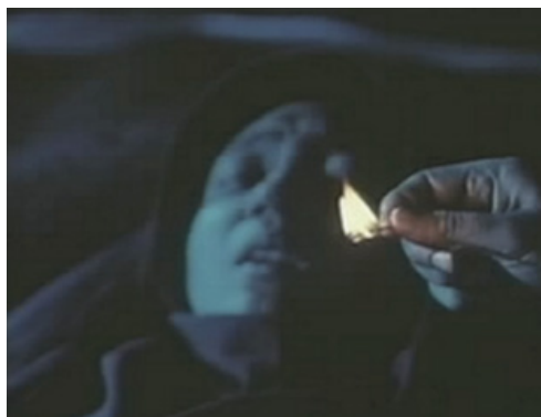
تصویر ۵- اپیزود هشتم.

برادربزرگش صفا سعی در صحبت با پری و تغییر حال و هوای روحی او دارد. در منبع اقتباسی این بخش در اپیزود سوم داستان زویی اتفاق می‌افتد. زمان، صبح یا بعد از ظهر و مکان، خانه پری و اتاق اسد و صفا و شخصیت‌ها شامل داداشی و پری و در بخشی مادر هستند. در این اپیزود داداشی، لباس تمرین که لباس رزم است به تن دارد که این خود به نوعی