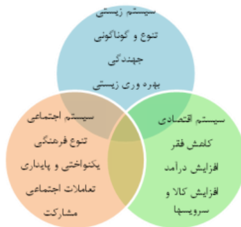
تصویر ۱. ابعاد و شاخص‌های توسعه پایدار.