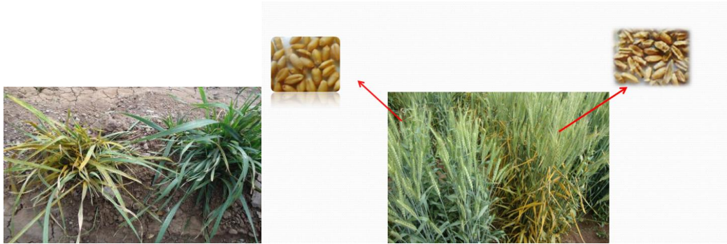
شکل ۱ - سمت چپ: واکنش گیاهچه‌ای در رقم‌های گندم مقاوم و حساس نسبت به زنگ زرد تحت شرایط مزرعه‌ای در اردبیل سمت راست: مقایسه بذور حاصل از رقم‌های حساس و مقاوم نسبت به زنگ زرد در اردبیل Fig 1. Left; seedling reaction in resistant and susceptible cultivars under field conditions of Ardabil. Right; comparison of seeds in resistant and susceptible cultivars

در این ژنوتیپ‌ها (Chen, 2013; Singh et al. , 2005). احتمال وجود ژن‌های کنترل کننده مقاومت نسبی یا تدریجی (مانند Y18 همراه با ژن‌های دیگر مقاومت تدریجی مانند Yr36 ) و یا ژن‌های مقاومت گیاه کامل در دمای بالا (HTAPR) زیاد است. از آنجا که این نوع