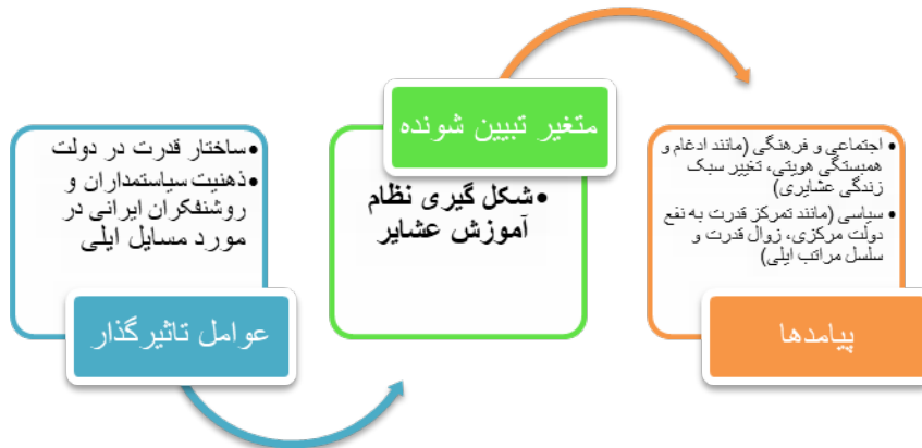
شکل ۱. عوامل تأثیرگذار و پیامدهای مهم نظام آموزش عشایری در ایران

ایلی، ادغام عشایر و همبستگی هویتی بوده است. در شکل ۱، رابطه بین عوامل تأثیرگذار بر شکل‌گیری نظام آموزشی عشایر و مهم‌ترین پیامدهای آن به نمایش گذاشته شده است.