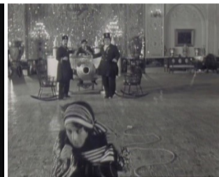
تصاویر ۹ و ۱۰- شکستن مرز میان محیط سینمایی و فضای واقعی در فیلم.