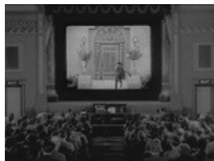
تصویر ۵- جذب‌شدگی در محیط سینمایی در فیلم سرلوک جونبور .