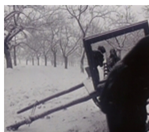
تصاویر ۱۵ و ۱۶- استفاده از آینه و حرکت برای شکستن پرسپکتیو سنتی. مأخذ: (تصویر برگرفته شده از فیلم)