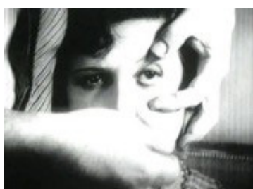
تصویر ۲ - فصل برش دادن چشم در سگ اندلسی بونوئل.