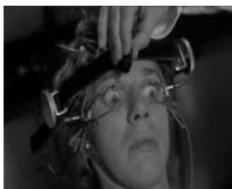
تصویر ۳ - باز نگاه داشتن چشمان الکس با ابزار مکانیکی در فیلم پرتقال کوکی .

استیون شاپیرو در کتاب بدن سینمایی (Shaviro, 1993) متأثر از فیلسوفانی همچون والتر بنیامین، موریس بلانشو، ژرژ باتای و ژیل دولز اهمیت بدن و جسمانیت ناظر در تجربه نظاره‌گری را مورد تأکید قرار می‌دهد. شاپیرو به بحث بلانشو پیرامون نگاه رجوع می‌کند. از منظر بلانشو، در الگوی غالب، دیدن نمایانگر قدرتی از سوی سوژه است، «دیدن دلالت می‌کند به فاصله، تصمیمی که موجب فاصله و جدایی می‌شود. قدرت در تماس نبودن و اجتناب کردن از ابهام تماس» (Ibid., 45). در تضاد با این الگوی غالب بلانشو از گونه دیگری از نگریستن یاد می‌کند: «اما چه اتفاقی می‌افتد هنگامی که آنچه نگاه می‌کنی، با وجود فاصله، به نظر می‌رسد که تو را در یک تماس عمیق لمس می‌کند، هنگامی که شیوه دیدن گونه‌ای از لمس است، هنگامی که دیدن تماس از فاصله دور است؟ چه اتفاقی می‌افتد هنگامی که آنچه دیده می‌شود خود را به نگاه خیره تحمیل می‌کند، به گونه‌ای که نگاه خیره تسخیر می‌شود...» (Ibid., 46). شاپیرو معتقد است تجربه سینمایی قرابت نزدیکی با این گونه از نگریستن مورد اشاره بلانشو دارد. در این حالت، فرد دیگر قادر نیست چیزها را در فاصله مناسب قرار دهد و آنها را به ابژه‌ها تبدیل کند. فاصله سوژه و ابژه در این لحظه محو و نابود می‌شود، و نگاه خیره ناظر، قدرت و سلطه‌اش را از دست می‌دهد. از این رو، فیلم گونه‌ای از هنر است که می‌توان آن را «ضد نگاه» خواند، هنری که از ظرفیت ناتوان‌سازی نگاه خیره برخوردار