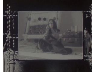
تصاویر ۱۳ و ۱۴- شکافته شدن پرده و شکسته شدن مرز میان سوژه و ایزه.