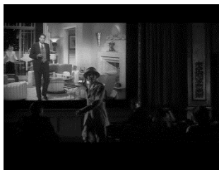
تصویر ۶- از میان رفتن مرز میان ناظر و منظر در فیلم رزارعوانی قاهره .

در این قسمت بنا به ضرورت روش شناختی و برای روشن شدن بحث کوشیده می‌شود بخش‌هایی از فیلم ناصرالدین شاه اکتور سینما (۱۳۷۰) ساخته محسن مخملباف از مدخل الگوی نظاره‌گری جسمانی مورد بررسی قرار گیرد. ناصرالدین شاه اکتور سینما داستان ورود سینما به ایران را روایت‌گری می‌کند و از این مدخل همچنین به مرور تاریخ سینما در ایران می‌پردازد. در طول داستان، دائماً صحنه‌هایی از فیلم‌های پیش‌ساخته‌شده سینمای ایران به نمایش در می‌آید و از این منظر، فیلم از کیفیت خود بازتابنده برخوردار می‌شود. میرزا ابراهیم خان عکاس باشی، در این فیلم، در سفری به فرنگ در ملازمت مظفرالدین شاه، با دستگاه سینماتوگراف آشنا می‌شود و به عنوان ارمغان سفر این دستگاه را به ایران می‌آورد. میرزا در رابطه با سینماتوگراف از شاه کسب تکلیف می‌کند، و فرانس باشی ساحر اشتباها او را به زمان گذشته، و اندرونی ناصرالدین شاه