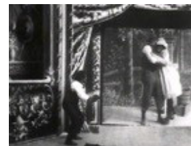
تصویر ۴- محو مرز میان فضای واقعی و سینمایی در فیلم عمو جاش در نمایش تصویر متحرک.