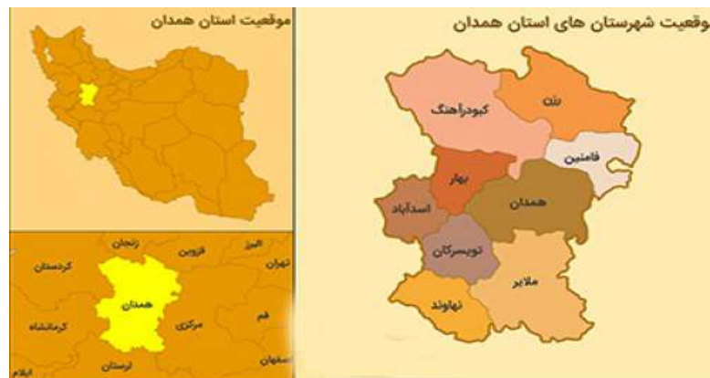
شکل ۲. قلمرو مکانی پژوهش

جامعه آماری محدود است (نه شهرستان استان) و همچنین با توجه به برابری تعداد نمونه و جامعه آماری، از روش تمام‌شماری استفاده شد. قلمرو مکانی تحقیق در شکل ۲ ارائه شده است.