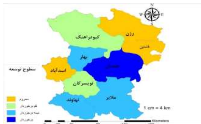
شکل ۳. نقشه پراکنندگی توسعه در شهرستان‌های استان همدان

از لحاظ سطوح توسعه اجتماعی، شهرستان همدان برخوردار، شهرستان‌های بهار، ملایر و اسدآباد نیمه‌برخوردار، شهرستان‌های تویسرکان و نهاوند کم‌برخوردار و شهرستان‌های فامنین، کبودرآهنگ و رزن محروم هستند. از لحاظ توسعه فرهنگی، شهرستان همدان برخوردار، بهار، ملایر و تویسرکان نیمه‌برخوردار، کبودرآهنگ کم‌برخوردار و شهرستان‌های نهاوند، فامنین، اسدآباد و رزن محروم‌اند. همچنین از لحاظ توسعه اقتصادی، شهرستان‌های همدان و بهار برخوردار، ملایر و نهاوند نیمه‌برخوردار، رزن و کبودرآهنگ کم‌برخوردار و شهرستان تویسرکان، اسدآباد و فامنین محروم هستند. براساس شکل ۳، به لحاظ توسعه، شهرستان همدان دارای وضعیت برخوردار، شهرستان‌های ملایر، بهار و نهاوند دارای وضعیت نیمه‌برخوردار، شهرستان‌های تویسرکان و کبودرآهنگ دارای وضعیت کم‌برخوردار و شهرستان‌های فامنین، اسدآباد و رزن محروم بوده‌اند.