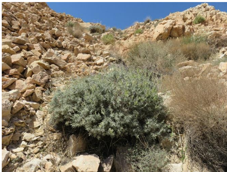
شکل ۱. گیاه مورتلخ ( Salvia mirzayanii ) در رویشگاه طبیعی سیرمند استان هرمزگان Figure 1. Salvia mirzayanii in Sirmand natural habitat of Hormozgan province

نزدیک‌ترین ایستگاه هواشناسی با اولویت ایستگاه‌های سینوپتیک استخراج گردید (جدول ۱).