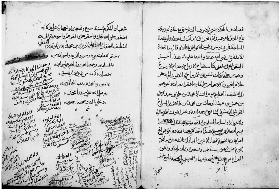
صفحات پایان متن تفاح الارواح - نسخه پرینستون