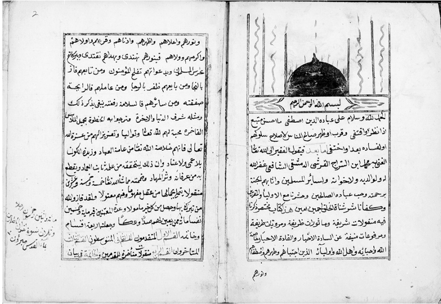
صفحات آغاز متن تفاح الارواح - نسخه خطی کتابخانه دانشگاه پرینستون