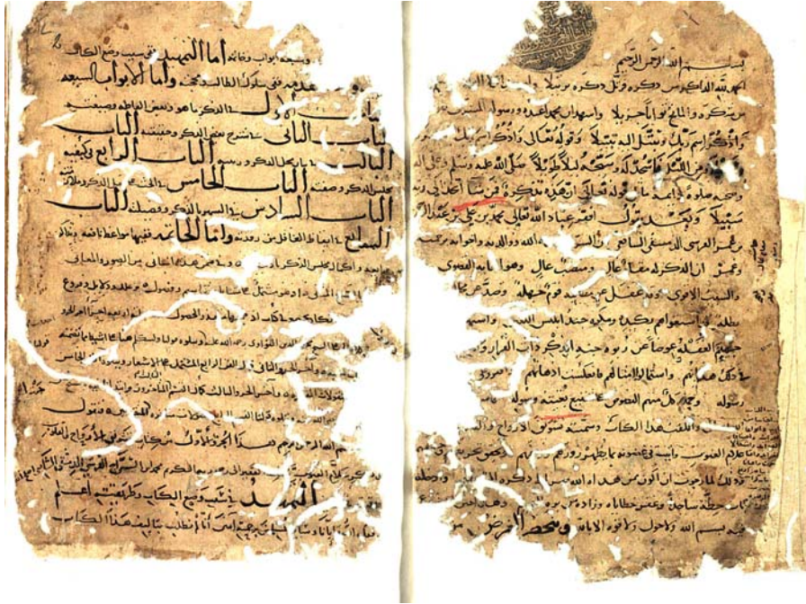
صفحات آغاز متن نسخه خطی تشویق الارواح والقلوب