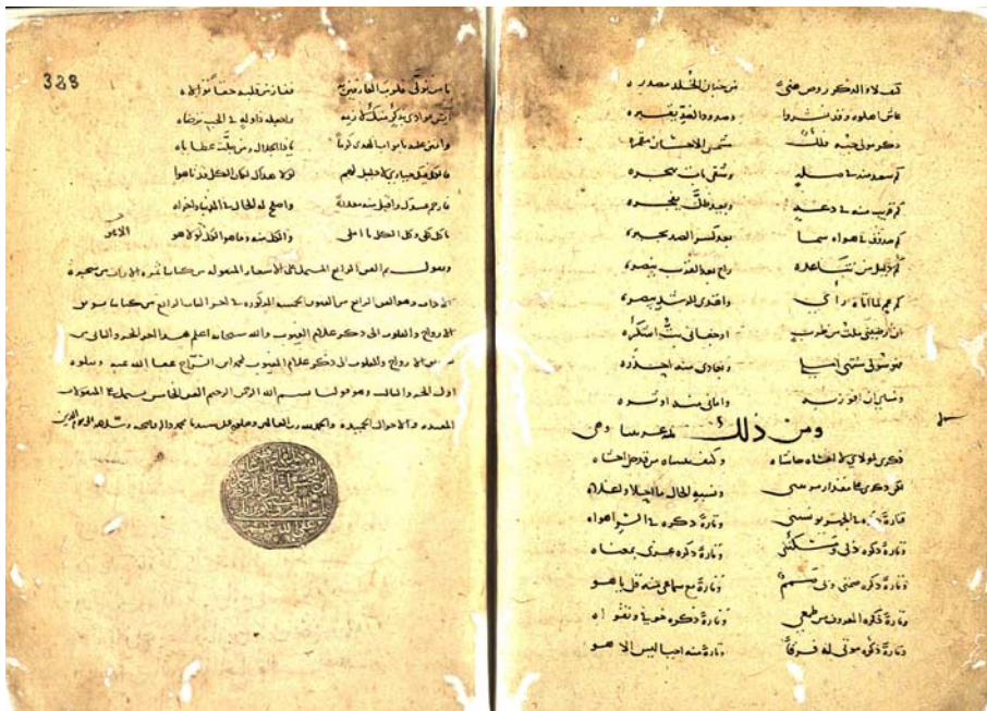
صفحات پایان متن نسخه خطی تشویق الارواح والقلوب