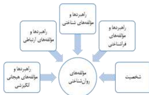
شکل ۲. مؤلفه‌های روان‌شناختی مرتبط با موفقیت دانشجویان در محیط یادگیری ترکیبی