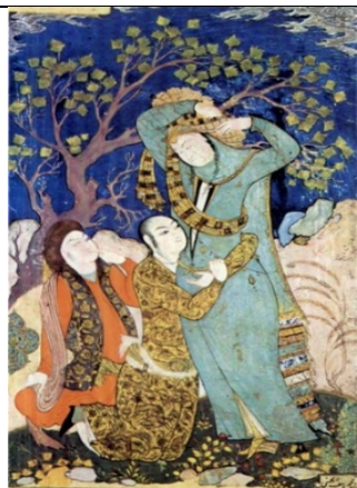
تصویر ۱۳. صحنه عاشقانه حلقه کردن دست بر دور کمر معشوق، محمد یوسف، اصفهان، حدود ۱۰۴۰ ه.ق/ ۱۶۳۱ م (پاکباز ۱۳۹۰: ۱۱۲)