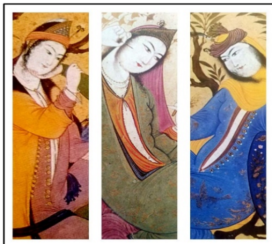
تصویر ۱. جامه‌های چاک‌دار تا کمر زنان در تصاویر تن‌کامه مکتب نقاشی اصفهان، جزئی از اثر (کنبی ۱۳۸۹: ۹۰، ۱۵۲ و ۱۵۴)

در نمونه نقاشی‌های مکتب اصفهان، که در آن‌ها مضامین جنسی و اعمال مرتبط با آن رواج یافته است و ما آن‌ها را تصاویر تن‌کامه می‌نامیم، به لحاظ تجسمی یک تفاوت اساسی با آثار مکاتب پیشین و معاصر خود دارند و آن اینکه زنان عموماً با لباس‌های باز یا بدن‌نما، که تا پایین کمر چاک خورده (تصویر ۱)، یا به صورت نیمه‌برهنه یا حتی برهنه تصویر شده‌اند (تصویر ۲ و ۳) و بر جنبه‌های جنسی آن‌ها تأکید شده است.