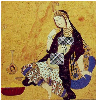
تصویر ۹. زن به همراه قلیان، محمدقاسم، اصفهان، حدود ۱۰۰۸ ه.ق / ۱۶۰۰ م. ( http://www.paintingsgalleries.com )