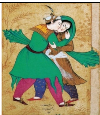
تصویر ۱۱. صحنه عاشقانه بوسیدن، رضا عباسی، اصفهان، حدود ۱۰۱۹ ه.ق/ ۱۶۱۰ م (Loukonine & Ivanovo 2014: 4)