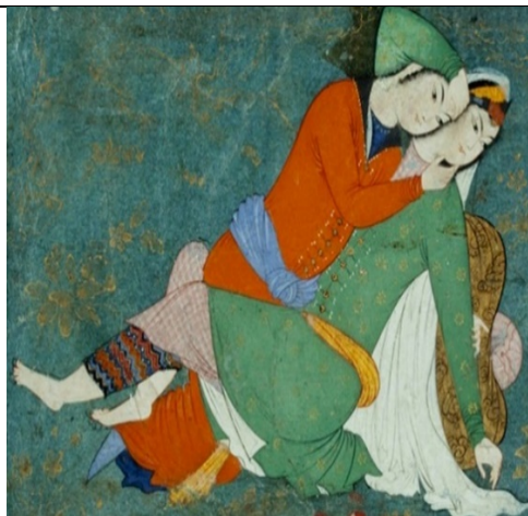
تصویر ۱۲. زوج عشاق، هنرمند ناشناس، اصفهان، حدود ۱۰۳۹ ه.ق/ ۱۶۳۰ م