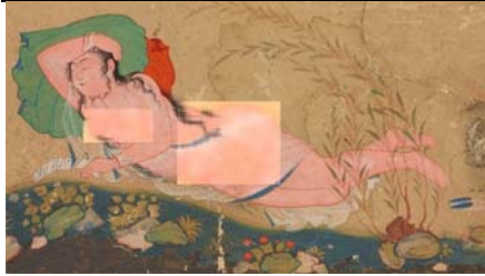
تصویر ۵. زن نیمه‌برهنه /مید، رضا عباسی، اصفهان، حدود ۱۰۰۹ ه.ق / ۱۶۰۱ م.