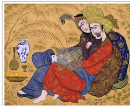
تصویر ۱۶. زن در حال عرضه جام به مرد در تصاویر تن‌کامه مکتب نقاشی اصفهان، افضل الحسینی، ۱۰۵۶ ه.ق / ۱۶۴۶ م. (Babaie 2009, 111)

زنان نیکو صورتی که با حالتی آرزومندانه در بی‌خبری مطلق ایستاده، نشسته یا لمیده‌اند، در حالی که زیبارویان دیگری با لطافت تنگ‌های ظریف شراب را در دست دارند و به آن‌ها عرضه می‌کنند و گاه بلعکس، زنان در حال عرضه جام‌ها به مردان هستند (تصویر ۱۶). آنتونی ولش ۱ بیان می‌کند که در آثار رضا عباسی می‌توان «نوعی احساس تجمل‌گرایانه اضافی و جسمانیت شهوت‌انگیز گستاخانه» دید (ولش ۱۳۸۵: ۲۰۲). رابرت انگ در وصف نگاره زوج عشاق (تصویر ۱۰ در جدول ۲) عقیده دارد که برآمدگی و فرورفتگی موزون اندام‌ها، جامه‌ها و عناصر واضح شهوانی-میوه، قرابه شراب، پای لخت، ناف عریان، سینه برجسته-همگی در قیاس با دیگر آثار این دوره شهوانیت بیشتری دارند. اندامشان القاکننده شور و شهوت است و گویی در حال یادآوری واقعه لذت‌انگیزی از گذشته‌اند (کنبی ۱۳۸۹: ۱۵۸ به نقل از انگ ۱۹۷۰: ۹).