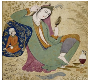
تصویر ۷. بانوی خیال پرداز، رضا عباسی، اصفهان، ۱۰۲۷ ه.ق / ۱۶۱۸ م. (کنی ۱۳۸۹: ۱۵۲)