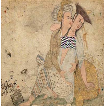
تصویر ۱۵. زوج عشاق، هنرمند ناشناس، اصفهان، حدود ۱۰۷۰ ه.ق / ۱۶۶۰ م. (همان)