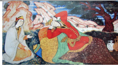
تصویر ۶. زن در حال کرشمه به همراه خدمه، نقاشی دیواری کاخ چهلستون، تالار مرکزی (آقاجانی اصفهانی و جوانی ۱۳۸۶: ۴۴)