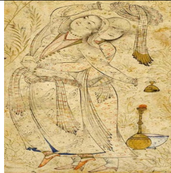
تصویر ۱۴. زوج عشاق، هنرمند ناشناس، اصفهان، حدود ۱۰۶۰ ه.ق / ۱۶۵۰ م. ( https://www.pinterest.com )

زنان نیکو صورتی که با حالتی آرزومندانه در بی‌خبری مطلق ایستاده، نشسته یا لمیده‌اند، در حالی که زیبارویان دیگری با لطافت تنگ‌های ظریف شراب را در دست دارند و به آن‌ها عرضه می‌کنند و گاه بلعکس، زنان در حال عرضه جام‌ها به مردان هستند (تصویر ۱۶). آنتونی ولش ۱ بیان می‌کند که در آثار رضا عباسی می‌توان «نوعی احساس تجمل‌گرایانه اضافی و جسمانیت شهوت‌انگیز گستاخانه» دید (ولش ۱۳۸۵: ۲۰۲). رابرت انگ در وصف نگاره زوج عشاق (تصویر ۱۰ در جدول ۲) عقیده دارد که برآمدگی و فرورفتگی موزون اندام‌ها، جامه‌ها و عناصر واضح شهوانی-میوه، قرابه شراب، پای لخت، ناف عریان، سینه برجسته-همگی در قیاس با دیگر آثار این دوره شهوانیت بیشتری دارند. اندامشان القاکننده شور و شهوت است و گویی در حال یادآوری واقعه لذت‌انگیزی از گذشته‌اند (کنبی ۱۳۸۹: ۱۵۸ به نقل از انگ ۱۹۷۰: ۹).