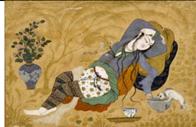
تصویر ۴. زن لمیده با کاسه شراب، افضل الحسینی، اصفهان، حدود ۱۰۵۰ ه.ق / ۱۶۴۰ م.