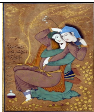
تصویر ۱۰. زوج عشاق، رضا عباسی، اصفهان، حدود ۱۰۳۹ ه.ق/ ۱۶۳۰ م (کنبی ۱۳۸۹: ۱۵۳)