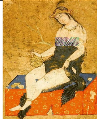
تصویر ۸. بانوی برهنه، هنرمند ناشناس، اصفهان، ۱۰۲۹-۱۰۵۰ ه.ق / ۱۶۲۰-۱۶۴۰ م. ( https://www.pinterest.com )