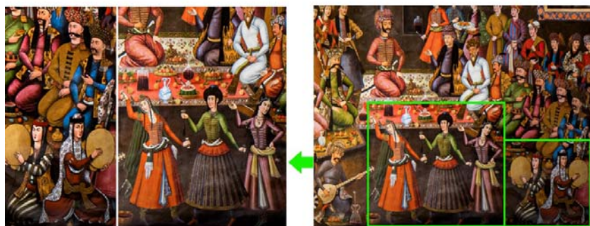
تصویر ۱۱۹. مجلس پذیرایی شاه عباس دوم از نذر محمدخان پادشاه ترکستان، اصفهان، دیوارنگاره کاخ چهلستون (همان).