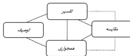
شکل ۱ - بازنمایی روش تحقیق پژوهش (بر اساس یافته‌های پژوهش حاضر).

این مطالعه از نوع کیفی، در سطح اکتشافی بوده و با روش مطالعه تطبیقی انجام شده است. تطبیق و مقایسه به عملی اطلاق می‌شود که در آن دو یا چند پدیده را در کنار هم قرار داده، به منظور یافتن وجوه اختلاف و تشابه آن‌ها را مورد تجزیه و تحلیل قرار دهیم. لذا در رویکردهای جدید عمدتاً به روش تطبیقی به مثابه یک لنز نگریسته می‌شود که می‌توان با آن محیط دور و نزدیک را همزمان مشاهده کرد و مستمراً موقعیت خود را نسبت به دیگران سنجید (Zaker, Salehi, 2017: 83). این مطالعه تطبیقی با بهره‌گیری از الگوی جورج بردی (1990) انجام شده است.