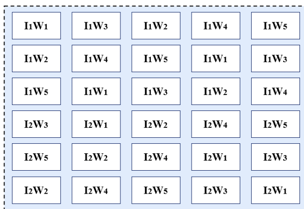
شکل ۲- جانمایی لایسیمترها به صورت شماتیک

به خاک اضافه شد و اضافه کردن خاک تا پر شدن لایسیمتر ادامه یافت. سپس مجدداً با افزودن آب و پس از نشست، فضای خالی باقی مانده تا ارتفاع پنج سانتی متر پایین تر از لبه فوقانی لایسیمترها، از خاک پر شد. برای تعیین خصوصیات فیزیکی و شیمیایی خاک، قبل از شروع آزمایش و اعمال تیمارها، نمونه برداری از خاک لایسیمترها انجام شد. خصوصیات فیزیکی و شیمیایی خاک در جدول (۲) آورده شده است.