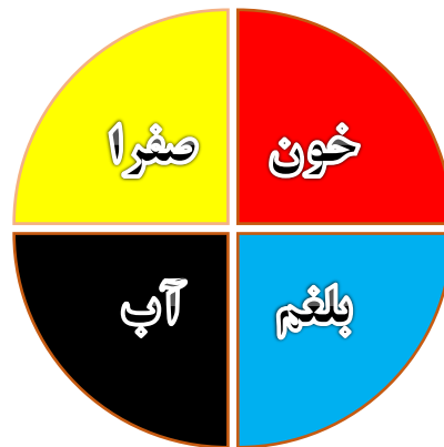
تصویر ۱. نظریهٔ اخلاط چهارگانهٔ بقراط

بنا بر این خلط چهارم در نظریهٔ اخلاط چهارگانهٔ بقراط آب است نه صفرای سیاه (سودا). بعدها این نظریه با نظریهٔ اخلاط چهارگانهٔ جالینوس که مان نظر مشهور است جایگزین شد.