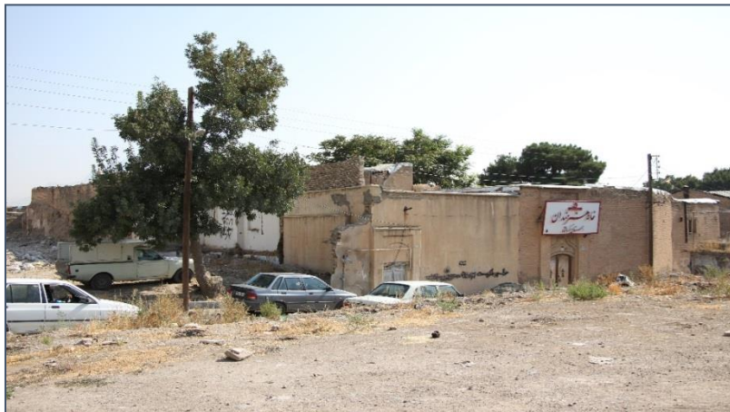
شکل ۲. بافت تاریخی در حال زوال در مرکز فیض‌آباد

دوم، بخش‌هایی از محله به‌ویژه بخش مرکزی (خیابانی که در ضلع غربی میدان جلیلی احداث شده است) از حیطة نظارت میراث فرهنگی خارج شده است و قیمت آن تحت تأثیر بازار و نوسانات آن قرار دارد. خیابانی که تا پیش از احداث آن، عابران برای گذر از فیض‌آباد و رسیدن به خیابان مدرس باید از کوچه‌های تنگ و پرپیچ‌وخم آن می‌گذشتند، اکنون خیابانی فراخ محسوب می‌شود که نحوه عبور و مرور را تغییر داده است. خانه‌های قدیمی و ارزشمند زیادی در این کوچه قرار دارند که اغلب خسته و متروک، زیر سایه ساختمان‌های بلند در حال ساخت جلوه‌ای ندارند و در انتظار بیل‌های مکانیکی هستند. خارج‌شدن از محدوده نظارت میراث فرهنگی و شروع ساخت و ساز در مرکز این محله در توانایی ساکنان نیست و در اختیار نهادها و ارگان‌های قدرتمند است.