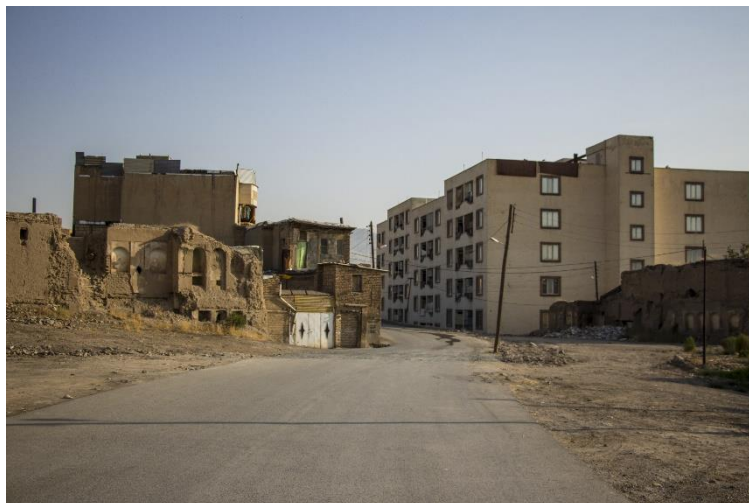
شکل ۱. تخریب بافت مسکونی قدیم و ساخت‌وساز جدید در مرکز فیض‌آباد