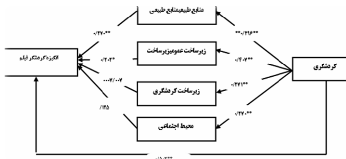
شکل شماره ۲. مدل عملیاتی پژوهش

در نهایت، با توجه به یافته‌های به‌دست‌آمده مدل عملیاتی پژوهش ترسیم گردید. برای تعیین برازش مدل، با استفاده از نرم‌افزار Lisrel، مقادیر مختلف برازش محاسبه شد. نتایج به‌دست‌آمده حاکی از آن است که با توجه به بالا بودن شاخص‌های برازش (NFI 1 (۰/۸۹)، CFI 2 (۰/۸۵)، IFI 3 (۰/۸۸) و GFI 4 (۰/۸۰) و پایین بودن شاخص خطای (۰/۰۹) SRMR 5 مدل مذکور از برازش مناسبی برخوردار است.