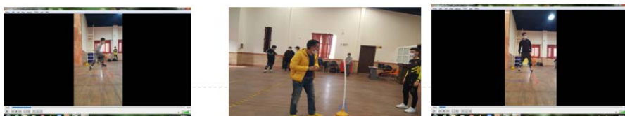
شکل ۲. نحوه انجام آزمون‌های سرعت و تغییر جهت