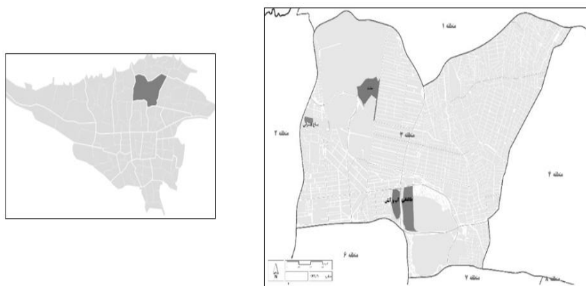
شکل ۲. تصویر سمت چپ: شهر تهران و موقعیت منطقه سه شهرداری تهران - سمت راست موقعیت چهار پارک ملت، آب‌و‌آتش، طالقانی و بوستان باغ ایرانی در منطقه ۳ تهران