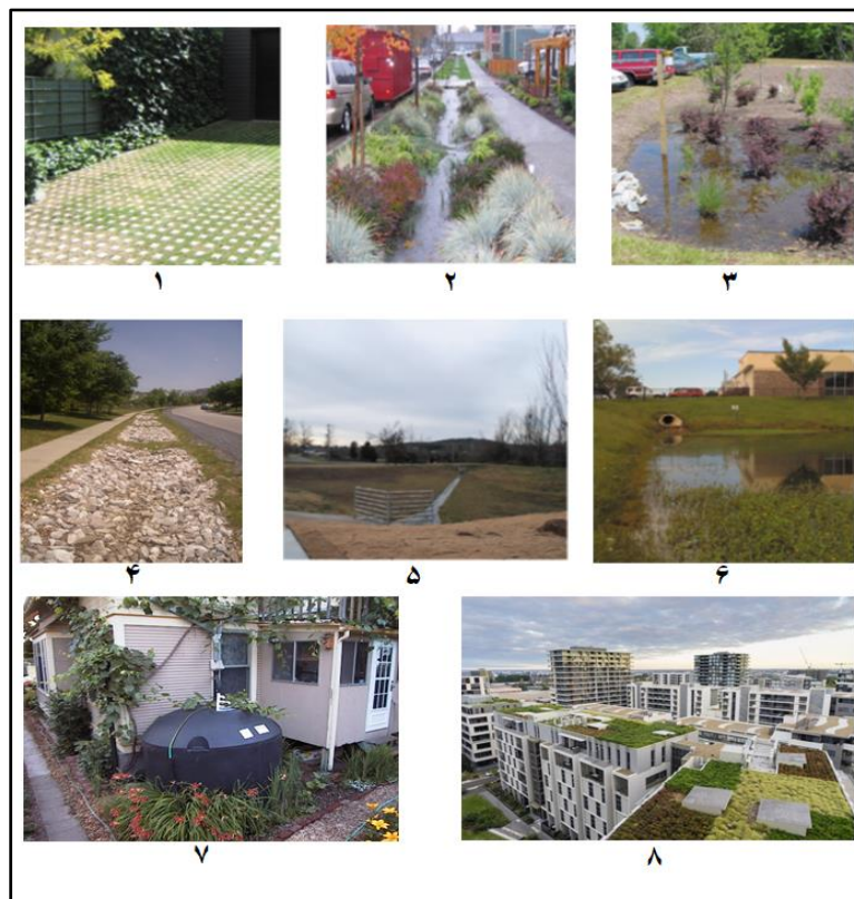
شکل ۲. انواع زیرساخت‌های سبز. ۱: کف‌سازی نفوذپذیر، ۲: جوی سبز، ۳: باغچه باران، ۴: ترانشه نفوذ، ۵: برکه نگه‌داشت، ۶: برکه نگه‌داشت زیستی، ۷: سیستم جمع‌آوری آب باران، و ۸: بام سبز

شده در چهار مقیاس رتبه‌ای بدون تاثیر (N)، تاثیر کم (L)، تاثیر متوسط (M)، تاثیر زیاد (H) تقسیم بندی شدند. سپس امتیازدهی به این معیارها از یک تا چهار صورت گرفت. نظر به تعیین وزن نسبی معیارها و زیرمعیارها در گام دوم، ماتریس تصمیم‌گیری جهت اولویت‌بندی زیرساخت‌های سبز در دسترس قرار گرفت. جدول ۲ نتایج مرور متون علمی در ارتباط با توانایی اشکال مختلف زیرساخت‌های