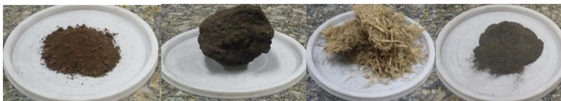
شکل ۲- مواد اولیه تیمارها به ترتیب از راست به چپ خاکستر باگاس، باگاس، فیلتریک، ویناس.