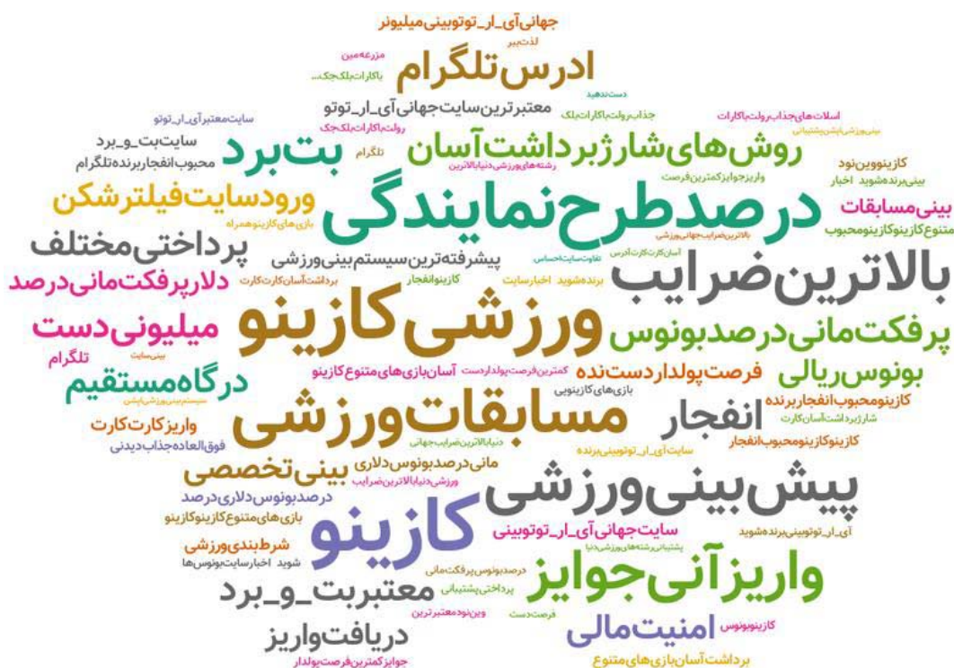
شکل ۳. نمونه‌ای از کلیدواژه‌ها در تلگرام و نشان‌دهنده مضمون «سوگیری کاهش درد پرداخت» در اقتصاد رفتاری

شمایی از کدگذاری مقوله‌ها در تحلیل محتوای پست‌های پربازدید، هشتگ‌ها و سوزده‌های داغ در جدول‌های ۷ و ۸ نشان داده شده است.