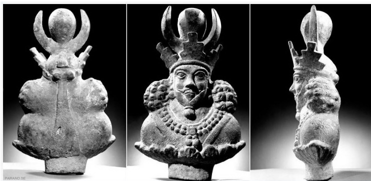
تصویر ۴- مجسمه بهرام، هادی شفائیه، حدود ۱۳۵۶.