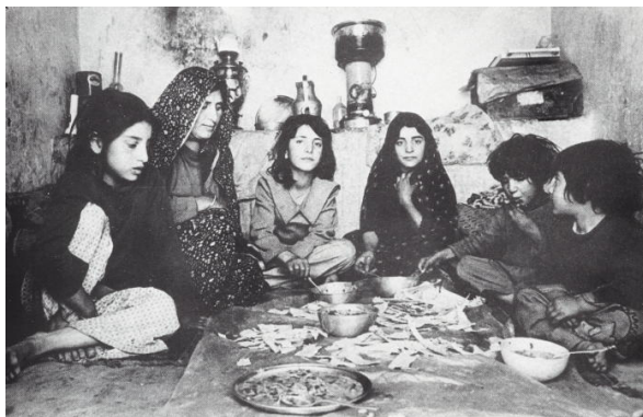
تصویر ۶- زنان در خانه؛ هنگامه گلستان، از مجموعه خمین، مأخذ: (روزنامه آیندگان)