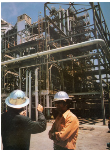
تصویر ۳- برونو باری، از کتاب/ایران: احیاء تمدن ازلی.

به‌عنوان یکی از عکاسان مهم و تأثیرگذار در جریان رئالیسم انتقادی، باید از کاوه گلستان نام برد که سه‌گانه‌اش با عنوان «کارگر، روسپی و مجنون»، علاوه بر چاپ در روزنامه/بندگان در سال ۱۳۵۵ در تالار فارابی دانشگاه تهران نیز به نمایش درآمد که با استقبال گسترده‌ای مواجه شد. به‌نظر می‌رسد کاوه گلستان با رفتن به سراغ چنین موضوعاتی به‌نوعی در تلاش بوده تا وضعیت خانواده ایرانی در آن روزگار را به تصویر بکشد: پدر خانواده (کارگری) که استثمار می‌شود، مادر خانواده و کودک خانواده (مجنون) که سرنوشتی بهتر از والدینش در انتظارش نیست ۱۶ (تصویر ۵). جالب این که گلستان در تصویرکردن کارگران، صراحتاً بر لباس‌های مندرس و وصله‌پینه‌شده‌ی آن‌ها تأکید می‌کند که به نظر می‌تواند نشانه‌ای از استثمار و بهره‌کشی از کارگران باشد. او هم‌چنین کارگران جنسی را در فضایی تیره، تاریک و دلگیر اتاق‌های محقرشان تصویر می‌کند که هیچ‌امیدی برای تغییر وضعیت‌شان باقی نمی‌گذارد. در واقع، گلستان با