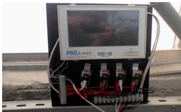
شکل ۳. ایستگاه فرمان نصب‌شده در گلخانه

گلخانه دارای دو سالن یکسان به مساحت کل ۱۶۰۰ مترمربع در مجاور یکدیگر بود. هر سالن دارای پنج فن با قطر ۱۲۰ سانتی‌متر، سیستم مه‌پاش (در ارتفاع ۳۸۰ سانتی‌متر از سطح زمین)، و سیستم پد (دارای سطح آبیگری به ارتفاع ۲/۱۵ سانتی‌متر و طول ۲۵ متر) بود. دبی پمپ آبرسان جهت مرطوب کردن پوشال‌ها ۵ lit/s بود. آبیاری به‌وسیله پمپ سانتریفوژ در صبح و عصر به مدت ۲ ساعت انجام می‌گرفت. بستر کشت رزها، مخلوط Cocopeat و Perlite بود. فاصله طولی پایه گل روی نوار کشت ۳۰-۲۵ سانتی‌متر، و فاصله عرضی آن‌ها ۷۰-۵۰ سانتی‌متر بود.