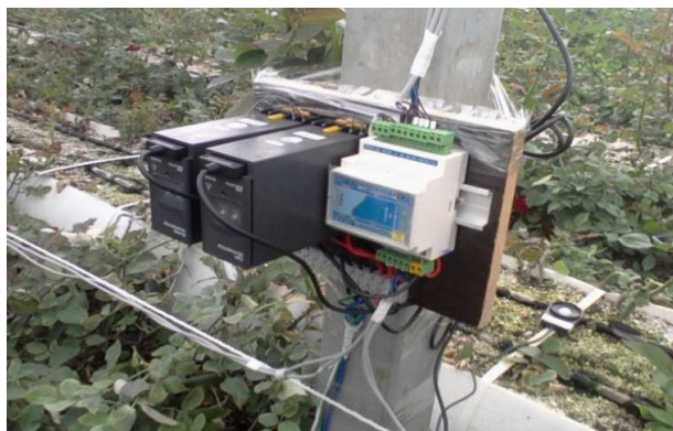
شکل ۲. ایستگاه اندازه‌گیری نصب‌شده در گلخانه

شدت نور در هر نقطه از سالن را فراهم می‌کرد. سیگنال‌های مربوط به حس‌گر رطوبت و شدت نور توسط کابل ۴×۰/۲۵ به واحد پردازنده مرکزی انتقال داده می‌شد.