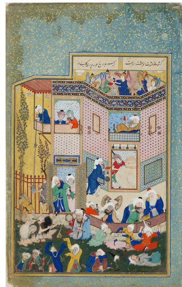
تصویر ۲- مستی لاهوتی و ناسوتی اثر سلطان محمد، ۱۵۳۱ تا ۱۵۳۳ م. / ۹۲۷ تا ۹۲۹ ه. ق. تبریز، دیوان حافظ سام‌میرزا، موزه متروپولیتن، 1988.430+L.2019.55.

تصرف هرات توسط شاه‌اسماعیل صفوی باعث شد بهزاد در پروژه‌های هنری دوره نخستین صفوی مشارکت کرده و تأثیر خود را در شکل‌گیری مکتب نگارگری تبریز اعمال کند و سلطان محمد نیز می‌کوشد از این زمینه‌ها بهره می‌برد. سلطان محمد برای تعلیم نقاشی به طهماسب‌میرزا از تبریز عازم هرات شده و مدتی را در آن گذرانده و از نزدیک سنت نگارگری مکتب هرات را تجربه کرده و با هنرمندان این مکتب از جمله بهزاد، آقا میرک اصفهانی، میر مصور و غیره آشنا شده است (آژند، ۱۳۸۴، ۲۴). او نه‌تنها دستاوردهای هنر بهزاد و سنت‌های هرات را جذب می‌کند بلکه برجسته‌ترین ویژگی‌های ترکمانان را نیز برمی‌گزیند تا دنیای تصویری خویش را فراخ‌تر کند. در این دوران شاهد ترکیب دو عنصر مهم در نگارگری ایران هستیم واقع‌گرایی که میراث بهزاد بود و کاربرد رنگ‌های شاد و متضاد که از مکتب ترکمانان تبریز برجای مانده بود (پاکباز، ۱۳۷۹، ۹۱). زندگی هنری سلطان محمد را می‌توان به دو مقطع تقسیم کرد. مقطع اول که پیوندهای او را با نقاشی پیش از صوفیان نشان می‌دهد بعضی از این پیوندها را می‌توان در نقاشی‌ها و نگاره‌های شاهنامه طهماسبی مشاهده کرد. شواهد اصلی مقطع دوم زندگی او در نگاره‌های دیوان حافظ جمع شده است (سوچک، ۱۳۷۷، ۱۸۵). با توجه به اینکه بنیان‌گذاری بهزاد در