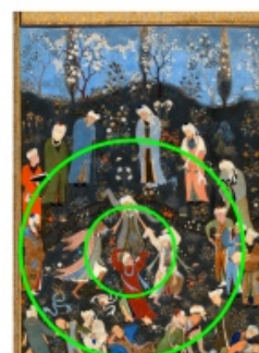
تصویر ۴- ترکیب‌بندی مدور.

جدول ۴- مطالعه تطبیقی شخصیت نگاره‌ها با توجه به رنگ جامه صوفیانه.