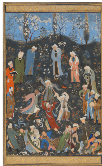
تصویر ۱- سماع درویشان اثر بهزاد ۸۹۵ ه.ق/ ۱۴۸۵ م. دیوان حافظ، موزه متروپولیتن، ۱۷.۸۱.۴.

دوره زندگی بهزاد با دو مقطع زمانی و دو شیوه متفاوت حکومتی مصادف بود. نیمه اول زندگی او، نیمه دوم سده ۹ ه.ق و حکومت سلطان حسین بایقرا را در برمی‌گیرد و نیمه دوم زندگی او، نیمه اول سده ۱۰ ه.ق و سی سال نخستین حکومت صفویان را شامل می‌شود (آژند، ۱۳۸۹، ۳۶۷). هرات در خلال سی‌وهشت سال پادشاهی حسین بایقرا، دوره‌ی دیگری از شکوفایی فرهنگی را تجربه کرد. اعتلای فرهنگی این دوره مرهون شخصیت و اقدامات میرعلی شیرنویسی (وزیر و خزانه‌دار سلطان) بود. عبدالرحمن جامی، صوفی و شاعر نامدار نیز در این زمان می‌زیست و هم او بود که میرعلیشیر را با درویشان نقشبندی آشنا کرد. بهاء‌الدین نقشبند ۷۱۷-۱۹۷ ه.ق، بنیان‌گذار فرقه‌ی نقشبندیه، که خود از سادات بود، پیروانش همگی عارف و صوفی بودند و در میان آن‌ها اهل هنر، همچون کمال‌الدین بهزاد ملاحظه می‌شود (شکاری نیری، ۱۳۸۵، ۴۳-۴۵). به همت و حمایت نوایی محفل انسی بین شخصیت‌های ادبی و هنری دوران شکل گرفت که بهزاد نیز از اعضای اصلی آن بود (آژند، ۱۳۸۹، ۳۷۳) یکی از نگاره‌های تک‌برگی که ظاهراً از نسخه‌ای کنده شده، نگاره سماع درویشان تصویر (۱) است که از قرار معلوم سرلوح یکی از کتاب‌های عرفانی می‌باشد (تجویدی، ۱۳۴۵، ۹). بهزاد در نگاره سماع درویشان نوعی پویایی طبیعت‌گرا و واقعی و حس معنوی قوی پدیدار ساخته و سلوک عرفانی را با سماع چهار صوفی در میانه‌ی ترکیب‌بندی به جلوه درآورده است. بهزاد از این نوع آموزه‌ها