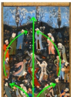
تصویر ۶- حرکت و پویایی.