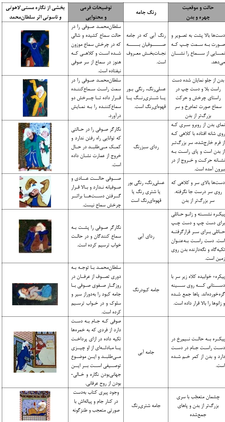
جدول ۲- ویژگی‌های تصویری نقش صوفیان در نگاره مستی لاهوتی و ناسوتی سلطان محمد.