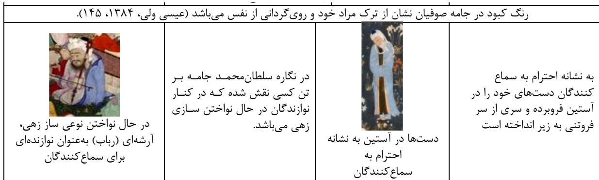
جدول ۵- مطالعه تطبیقی عناصر بصری در نگاره سماع درویشان و مستی لاهوتی و ناسوتی.