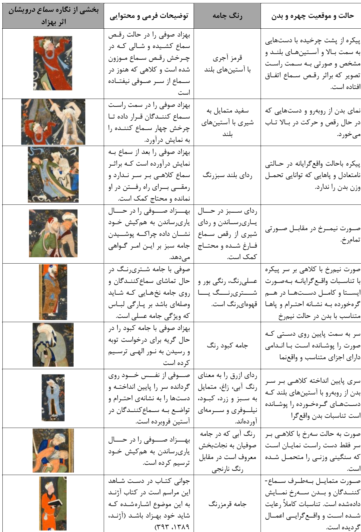
جدول ۱- ویژگی‌های تصویری نقش صوفیان در نگاره سماع درویشان بهزاد.