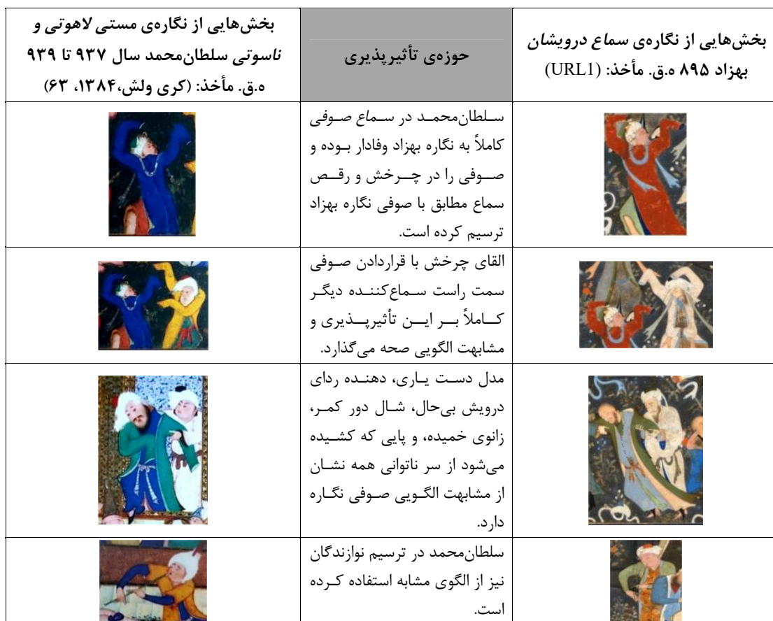
جدول ۳- الگوهای تصویری مشابه در دو نگاره.

در دو نگاره شاهد صوفیانی با احوالات دگرگون هستیم و همین‌طور افرادی که وظیفه کمک‌رسانی را اعمال می‌کنند. چند تن از صوفیان