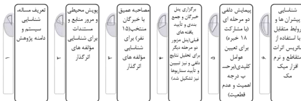
شکل ۱. چارچوب و گام‌های روش پژوهش

در شکل ۱ خلاصه‌ای از فرایند اجرایی پژوهش مشاهده می‌شود.