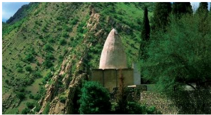
تصویر ۲: نمایی از مقبره بابایادگار

«بقعه بابایادگار» بر بالای تیغه بلندی از کوه «گرا» که دره‌ای عمیق و پوشیده از درختان جنگلی، حاشیه آن را به صورت پرتگاهی مخوف قطع کرده، واقع شده است. از نظر معماری این بنا از یک اتاق چهارضلعی با گنبدی مخروطی شکل و یک پیش‌فضا یا کفش‌کن که به شکل سایه‌بانی چسبیده به دیوار ورودی بقعه و دو ستون در بخش بیرونی، تشکیل شده است (نظری، ۱۳۹۲: ۳۳). سطوح داخلی و خارجی این بنا به وسیله ملات گچ، آندود شده است. فیلیوش‌های این بنا در تمام بناهای اسلامی منطقه بان زرده و به ویژه در آرامگاه‌های گورستان ابودجانه دیده می‌شود (همان: ۳۴). گلزاری عقیده دارد هویت حقیقی «بابایادگار» مانند دیگر مشایخ اهل حق به تحقیق معلوم نیست، ولی از آنجاکه غالب این مشایخ در اوایل حکومت صفویان زندگی می‌کرده‌اند ردپایی در تاریخ از آنان می‌توان سراغ کرد. مطلب قابل‌ملاحظه این است که این مشایخ غالباً در نوار مرزی ایران و عثمانی به ترویج مذهب اهل حق که درست نقطه مقابل معتقدات ساکنان قلمرو عثمانیان بوده، اشتغال داشته‌اند (گلزاری و جلیلی، ۱۳۴۷: ۱۴۱).