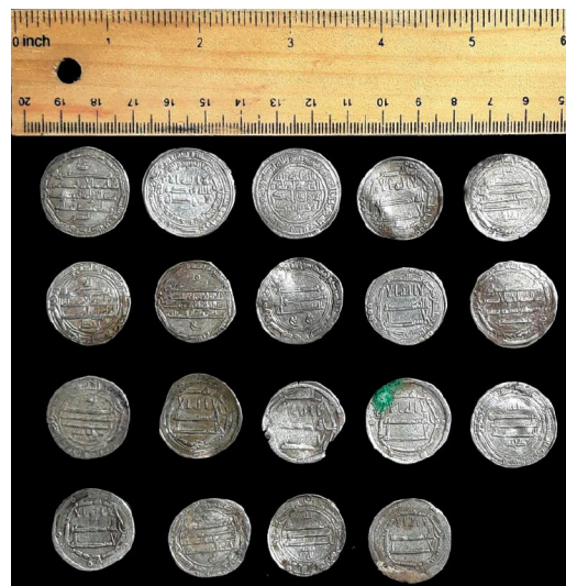
تصویر ۶: تصویری کلی از سکه‌های کشف‌شده.