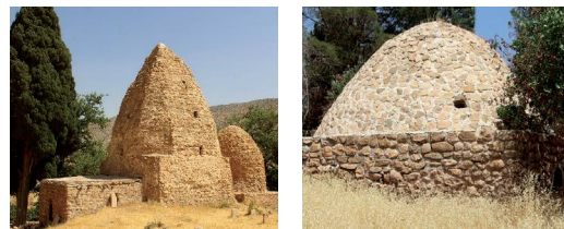
تصاویر ۴ و ۵: نمایی مقبره آبودجان

گلزاری عقیده دارد: انتساب این قبر به آبودجان بسیار بعید به نظر می‌رسد و می‌نویسد: «به طوری که می‌دانیم در این نواحی قبور دیگری نیز به بزرگان و صحابه منسوب هست در حالی که صحت آنها مشکوک می‌باشد، مانند انتساب قبر «ویس نازار» به اویس قرنی، زاهد معروف که در جنگ «صفین» کشته شده است» (همانجا).