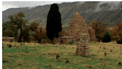
تصویر ۳: نمایی از گورستان و مقبره آبودجان

گورستان آبودجان ۹ کیلومتری قلعه یزدگرد قرار دارد؛ این گورستان مربوط به سده‌های میانه و متأخر دوران‌های تاریخی پس از اسلام است و در دهستان بان زرده، ۷۰۰ متری شمال غربی روستای باباجان واقع شده که در فهرست آثار ملی نیز ثبت شده است. این گورستان سه هکتاری با بناهای جالب در سمت راست جاده دیده می‌شود. باستان‌شناسان تعداد گورهایی را که داخل این قبرستان تاریخی وجود دارد، حدود ۶۵۰۰ گور اعلام کرده‌اند (ایسنا، ۱۳۹۹) البته تعداد زیادی از آنها قبور متأخر هستند. روی برخی از سنگ‌ها نقوش گیاهی، اسلیمی، حیوانی، شمشیر، نیزه و انسان سواره حکاکی شده است. همچنین نقش الهه نیکه (ایزدبانوی پیروزی) که فرشته‌ای بالدار و از خدایان یونان باستان است و نمونه آن روی سردر طاق‌های طاق‌بستان نقش بسته نیز روی برخی از سنگ قبرهای آبودجان دیده می‌شود (همان).