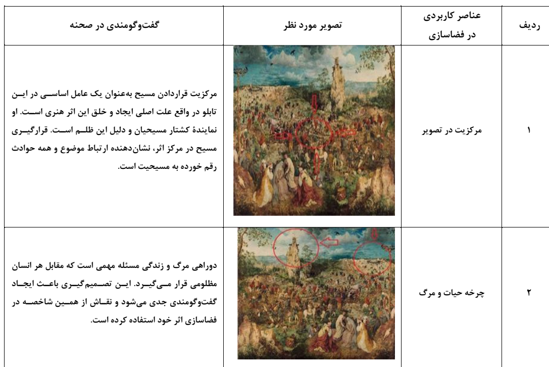
جدول ۶- گفت‌وگومندی در انواع فضاسازی‌های موجود در تابلو.

که در انتظار اجساد هستند، نقاش که به بیننده پشت کرده تا با نادیده گرفتن خود توجه مخاطب را به حوادث معطوف نماید (اما در واقع این یک نوع ترفند در نقاشی می‌باشد که نه تنها مانع تمرکز و توجه نمی‌شود بلکه توجه بیشتری را جلب می‌کند) و صحنه‌ای که در آن انسان‌ها برای حفظ جان و زنده ماندن از شهر فرار کرده و به جنگل پناه می‌برند. اما در بخش دوم که می‌توان آنها را صحنه‌های چندصدایی نامید کم‌تر خبر از افکار و رفتارهای منفی دیده می‌شود و در آن‌ها تداعی افکار و رفتارهای متنوع و گاهی حاوی آزادی بیان و عقیده دیده می‌شود. این صحنه‌ها عبارت‌اند از تعداد کم‌تر مردم عادی نسبت به سربازان، ایستادگی و مقاومت در مقابل ظلم، همراه شدن سربازان و مردم عادی با هم در بعضی صحنه‌ها، حرکت سربازان و مردم در یک مسیر، حضور مریم در سه مقطع زمانی مختلف (شاید به نشانه مقاطع مختلف زندگی انسان)، عادی سازی شخصیت مسیح در حد مردم عادی و مورد ظلم قرار گرفتنش و در نهایت چرخه حیات یا زندگی. این صحنه‌ها همگی دارای پیام‌های چندصدایی هستند که به صورت