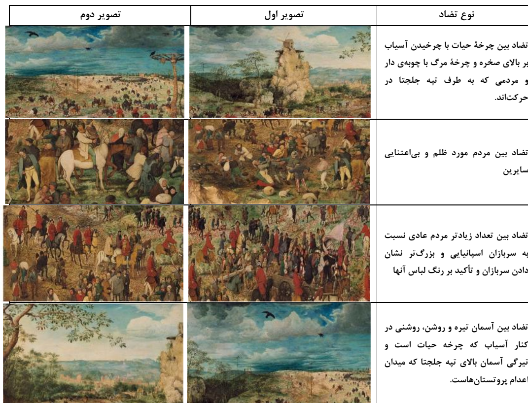
جدول ۴- حالات روحی و حرکات.