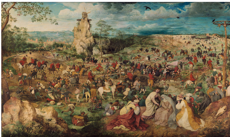
تصویر ۱- نقاشی راهی به جُلجتا اثر پیتر بروگل، ۱۵۶۴ م.

قسمت‌های مهمی که در نقاشی به تصویر کشیده شده عبارت‌اند از: ۱. صحنه به تصویر کشیده شده از مریم در سه مقطع سنی (سمت راست جلوی تابلو)، ۲. تصویری از نقاشی که تقریباً در مرکز متمایل به چپ می‌باشد، ۳. تصویر عده‌ای از مردم که در حال مقاومت در برابر حمله سربازان متجاوز هستند (سمت راست تابلو)، ۴. تصویر گاری حامل اعدامی‌ها که مردم در حال تماشای آنها هستند، در حالی که مسیح مصلوب شده به دنبال گاری اعدامی‌ها کشیده می‌شود (در مرکز تصویر)، ۵. تصویر یک صخره بلند و یک آسیاب که بر فراز آن قرار گرفته است (در سمت چپ، عقب تصویر) و ۶.