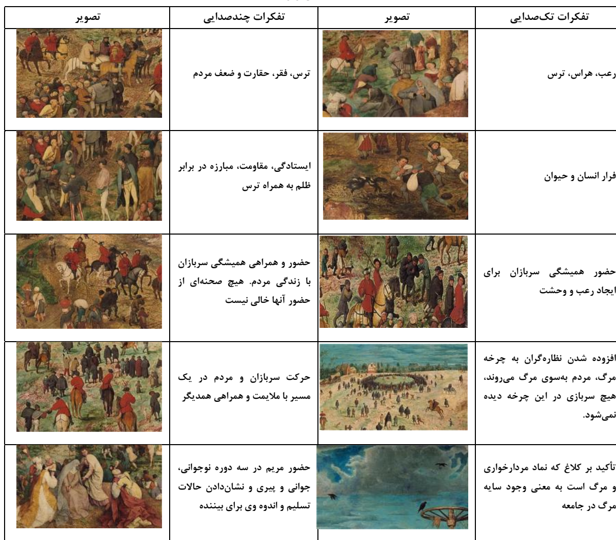
جدول ۵- صداهای برگرفته از افکار.

سربازان سرخ‌پوش به‌عنوان قدرت برتر در حال ظلم به مردم هستند و دین و دنیای مردم را در اختیار دارند. عده‌ای از مردم معترض به این ظلم هستند و عده‌ای دیگر آن را پذیرفته و با آن کنار آمده‌اند. دسته‌ای نسبت به همه‌چیز (ظلم، کشتار، غارت و یا مرگ مسیح) بی‌خیال‌اند و سرخوش به تماشای اعدام هم‌وطنان خود می‌روند و در این میان نقاش را مشاهده می‌کنیم که بدون توجه به مخاطب به ثبت واقعیت می‌پردازد. تفکرات منجر به ایجاد