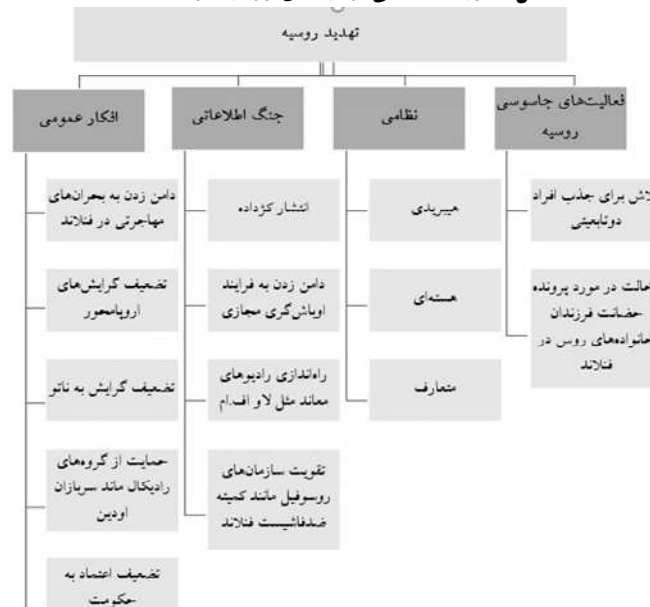
شکل ۲. ریخت‌شناسی تهدیدهای روسیه در فنلاند