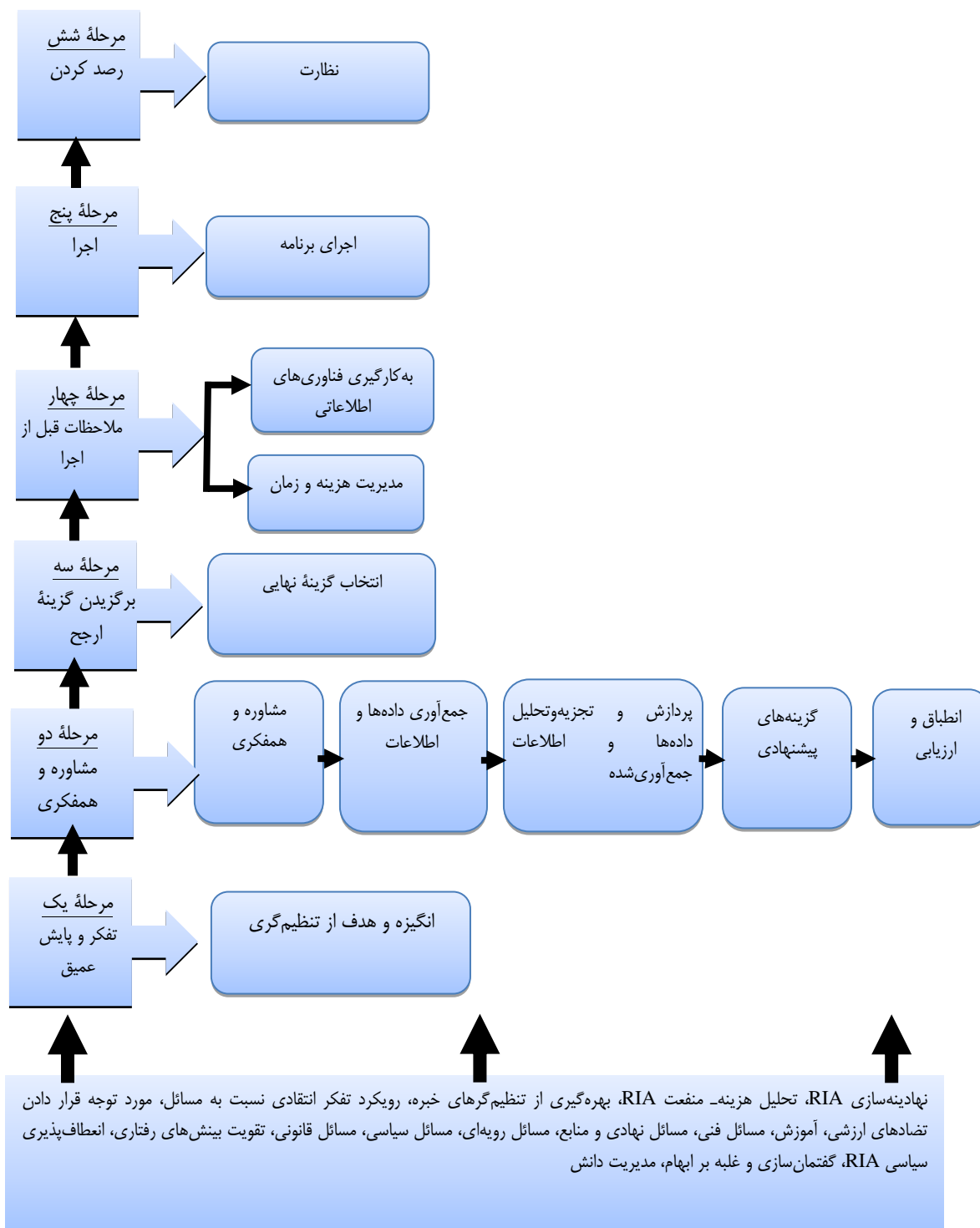
شکل ۳. چارچوب ارزیابی تأثیرات تنظیم‌گری (RIA) مبتنی بر پیشینه پژوهش