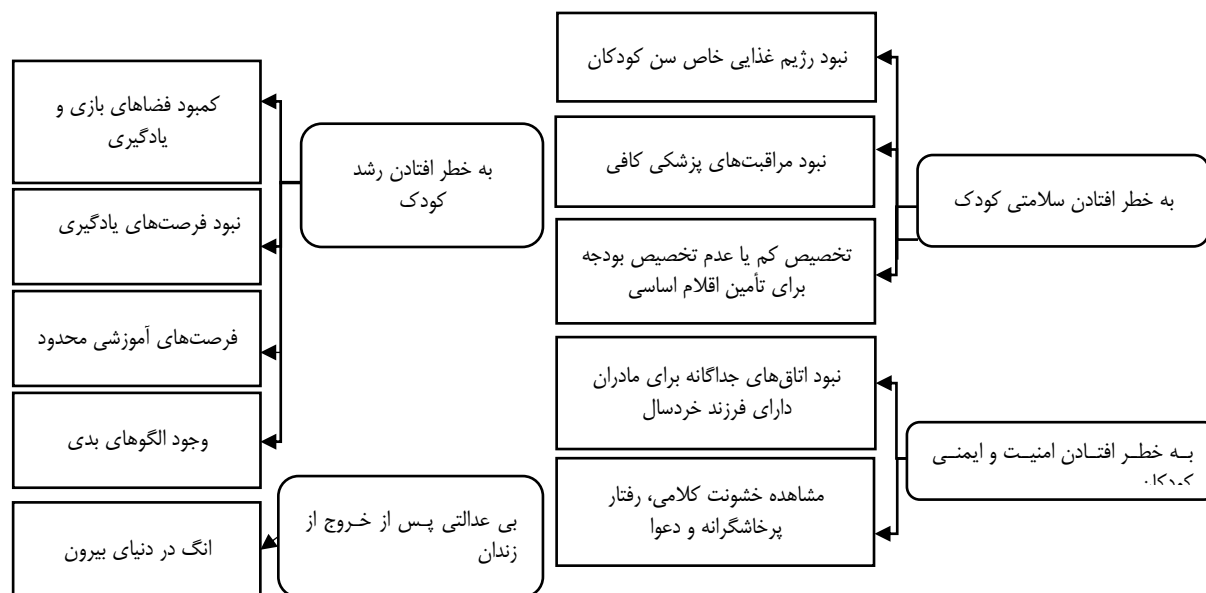
شکل ۱: مهمترین مشکلات شناسایی شده از تحلیل پژوهش‌های پیشین (پژوهشگر)

تفاوت پژوهش حاضر با پژوهش‌های پیشین این است که تمرکز این پژوهش بر ۱. شناسایی حقوق کودکان همراه با مادران زندانی براساس مواد مطرح شده در قوانین و اسناد بین‌المللی و داخلی، ۲. شناسایی مشکلات و نیازهای کودکان همراه با مادران زندانی در طول زندگی در زندان در کشور ایران بوده است.