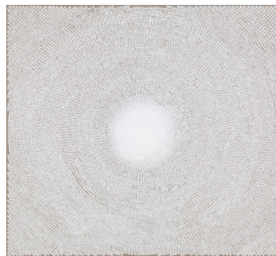
تصویر ۱- کامران یوسفزاده، دغاهای بی‌پایان، ۲۰۱۵، ترکیب مواد روی بوم، ۷۶،۲ * ۵۷،۲ سانتی‌متر

در معماری مساجد، مرکز گنبد، مظهر حقیقت ابدی تلقی می‌گردد. یوسفزاده این مفهوم را بر روی بوم، با نور سفیدی که از مرکز گنبد بیرون می‌زند، به مخاطب منتقل می‌کند. نوع به تصویر کشیدن نور سفید در مجموعه «گنبدهای سفید»، نوری منتشر شده در تمام سطح بوم است. استفاده از رنگ‌های درخشان در این مجموعه آثار، صرفاً برای نشان دادن تمثیلی از نور است. سؤال این است که او با ترکیب عناصر تمثیلی ماندالا و نور به دنبال بیان چه محتوایی است؟ یوسفزاده این تمثیل‌ها را به عنوان کالبدی برای مفاهیم معنوی در عالم محسوسات می‌داند. در آثار یوسفزاده، نور به عنوان تمثیلی از حقیقت محض در مرکز گنبد بر روی بوم نقش بسته است. اندیشه نورانی یوسفزاده در تابلوهای «گنبد سفید» او، سبب استفاده هنرمند از رنگ‌های نورانی، کاملاً شفاف و بدون کدورت شده است و سایه در این آثار به عنوان وجه پست نفس انسان حذف گردیده است. «به جرأت می‌توان گفت نور عام‌ترین صفت حق (و وجود او) در تمامی ادیان و مذاهب، از مذاهب اولیه گرفته تا ادیان پیشرفته و حتی فرهنگ‌ها و تمدن‌هاست» (بلخاری، ۱۳۹۰، ۳۴۰). در هنر ایرانیان نیز، نور دائماً در حال تکرار است. «اولین نمونه از حضور هاله نورانی انسان در نگارگری ایرانی نسخه‌ای از رساله خطی منسوب به جالینوس مربوط به مکتب نگارگری سلجوقی می‌باشد که تمامی شخصیت‌های موجود در تصویر، دارای هاله‌ای نورانی هستند» (همان، ۳۶۲-۳۶۱). در عرفان افرادی