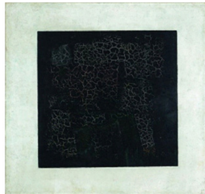
کازیمیر ماله‌ویچ، مربع سیاه (۱۹۱۵)