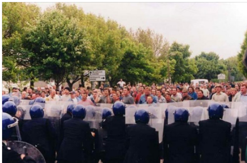
جرمی دلر، نبرد اورگریو (۲۰۰۱)

نامیده می‌شود. اواخر دهه نود شاهد توسعه «هنر رابطه‌ای» ۱۶ بودیم. در هنر رابطه‌ای، کار هنری شامل مشارکت افراد در یک نمایش عمومی است و از این طریق «تکمیل» می‌شود. در این نوع هنر اثر هنری موجب ایجاد روابط اجتماعی می‌شود. نقطه‌ضعف بسیاری از هنرهای ارتباطی اولیه، بی‌احساس بودن آن بود: روابط اجتماعی که این هنر به آن توسل می‌کرد از تمایل به یک کل خوش آیند و پر جنب و جوش فراتر نمی‌رفت؛ مانند سایت آزمایشی از کارستن هولر ۱۷ که در آن او چندین سرسره فلزی عظیم در سالن توربین موزه تیت مدرن نصب کرد تا بازدیدکنندگان بتوانند سوار شوند و به پایین سر بخورند. سپس، تحت تأثیر جنبش ضد سرمایه‌داری و ظهور مجدد یک جریان چپ در ایالات متحده، هنر رابطه‌ای افراطی رادیکال و به «هنر مشارکتی» ۱۸ تبدیل شد. هنر رابطه‌ای تلاش کرد تا از گالری‌ها بیرون برود تا با مردم طبقه کارگر و جوامع تحت ستم، کار کند. نمونه‌ای از این مورد در بریتانیا، بازسازی مجدد نبرد اورگریو ۱۹ توسط جرمی دلر از اعتصاب بزرگ معدنچیان در سال‌های ۱۹۸۴-۱۹۸۵ است و مورد دیگر مشارکت هنرمندان فعال اجتماعی که نقش مهمی در تسخیر وال استریت در سال ۲۰۱۱ ایفا کردند.