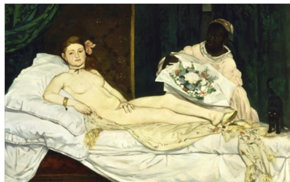
ادوارد مانه، المپیا (۱۸۶۳)