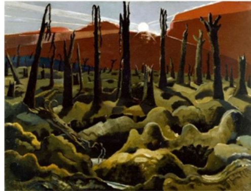
پل نش، ما در حال خلق جهانی تازه‌ایم (۱۹۱۹)

نکته مهم این است که این امر اغلب در سبک‌های هنری کاملاً متضاد منتقل می‌شد؛ بنابراین جنگ، هم هنری را به وجود آورد که وحشت سنگرها را مانند هنر پل نش و اتو دیکس به تصویر می‌کشید و هم هنر انتزاعی و مفهومی میدان سیاه ماله‌ویچ (۱۹۱۵) و فواره مارسل دوشان (۱۹۱۷) را به وجود آورد که سعی در به چالش کشیدن کلیت فرهنگ بورژوازی داشت.