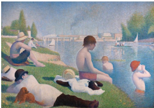
جرج سورا، حمام کنندگان (۱۸۸۴)

ما شاهد روند مشابهی در آمریکا در دهه‌های ۱۹۴۰، ۱۹۵۰ و ۱۹۶۰ با اکسپرسیونیسم انتزاعی، هنر پاپ و مینیمالیسم هستیم. اکسپرسیونیسم انتزاعی در اواخر دهه چهل با نقاشی‌های قطره‌ای جکسون پولاک و نقاشی‌های میدان رنگی مارک روتکو به اوج خود رسید. اکسپرسیونیسم به‌طور کلی تصویر کردن اشیای سه‌بعدی را رد کرد و خود را در مقابل «هنر بازاری و بنجل» فرهنگ عامه توده‌ها قرار داد. به محض اینکه اکسپرسیونیسم انتزاعی خود را تثبیت کرده بود، ابتدا توسط چهره‌های انتقالی مانند رابرت راثشونبرگ و جسر جانز و پس از آن به طرز چشمگیری توسط اندی وار هول که هنرش دقیقاً مبتنی بر تصویرسازی اشیا و اشخاص سه‌بعدی بود، به چالش کشیده شد. اشخاص و اشیاء متعلق به فرهنگ عامه مانند قوطی سوپ، اسفنج ظرف‌شویی، مریلین مونرو و الویس