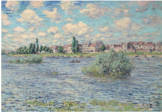
کلود مونه، رود سن از منظر لاواکورت ۱۸۴۰

سیسلی و رنوار بود که هنر اروپا را برای همیشه تغییر داد. اما این امر مستلزم از دست دادن تمرکز بر فرم بود و هنرمندان بزرگی که بلافاصله پس از آن آمدند مانند سورا، ونگوگ و سزان، همگی بر دستاوردهای امپرسیونیسم با نور بنا نهاده شدند، اما همچنین به روش‌های مختلف سعی کردند فرم را بازتعریف کنند. به عبارت دیگر در این مورد یک تحول دیالکتیکی وجود داشت.