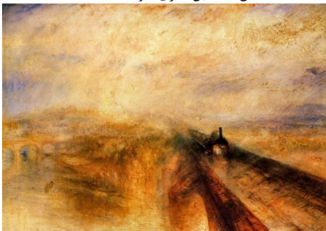
ویلیام ترنر، باران، بخار و سرعت (۱۸۴۴)

دوره دیگری که باعث ایجاد گرایش‌های متضاد شد، جنگ جهانی اول بود. واضح است که ابعاد و وحشت این رویداد بر هنرمندان بزرگ آن روز تأثیر گذاشته است. با این حال،