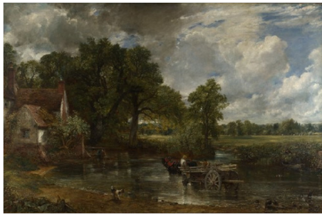
جان کانستبل، گاری علوفه (۱۸۲۱)

به طور خلاصه یک رابطه دیالکتیکی بین هنر و جامعه وجود دارد؛ بنابراین دو هنرمند بزرگ از یک دوره و یک نقطه از جهان ممکن است به وقایع تاریخی یکسان به روش‌های بسیار متفاوت پاسخ دهند. یک مثال در این مورد می‌تواند روبنس و رامبراند باشند. روبنس (۱۵۷۷-۱۶۴۰) در آنتورپ و رامبراند (۱۶۰۶-۱۶۶۶) در آمستردام مستقر بودند. هنر رامبراند تا حد زیادی محصول شورش هلند ۴ بود، انقلابی بورژوازی که جمهوری هلند را تأسیس کرد، در حالی که هنر روبنس سفارشی و جریان اشرافی ضدانقلاب پادشاهی هابسبورگ بود. مثال دیگر تقابل بین جان کانستبل (۱۷۷۶-۱۸۳۸) و ویلیام ترنر (۱۷۷۵-۱۸۵۱) است، دو هم عصری که در انگلستان در طول انقلاب صنعتی کار می‌کردند، در حالی که کانستبل یک زندگی روستایی آرام باشکوه را به تصویر می‌کشد که حومه‌ای باثبات انگلیسی را تداعی می‌کند که در آن تکلیف همه چیز مشخص است، ترنر به همان اندازه باشکوه نیروهای پویایی که جهان را تغییر می‌دهند را بیان می‌کند.