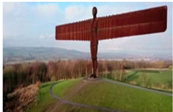
آنتونی گورملی، فرشته شمال (۱۹۹۸)