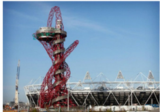
آنیش کاپور، آرکلاز متال اربیت (۲۰۱۲)

این بخش می‌توانم به افرادی مانند دیمین هرست، جف کونز، آنتونی گورملی، آی. وی. وی و آنیش کاپور اشاره کنم. در حالی که برخی از این آثار هنری مانند فرشته شمال اثر گورملی ۱۴ ، می‌توانند از نظر بصری قدرتمند باشند. بسیاری از آن‌ها کاملاً خالی از مفهوم هستند، ویژگی اصلی آن‌ها صرفاً مقیاس و پرهزینه بودنشان است. آنیش کاپور نمونه‌ای از این موارد است. در سال ۲۰۰۳ او اثر مارسیاس که به همراه مهندس سیسیل بالموند طراحی شده بود را در تالار توربین موزه تیت مدرن نصب کرد. مجسمه‌ای به طول ۱۵۰ متر و ده طبقه که احتمال دارد یکی از بزرگ‌ترین آثار نمایش داده شده در یک گالری باشد. سبب ارکلاز متال اربیت ۱۵ که آن هم با همراهی سیسیل بالموند برای المپیک لندن طراحی شده بود، پس از تصمیم شهردار لندن، بوریس جانسون و وزیر المپیک تسا جوول به بهره‌برداری رسید، این برج ۱۱۴٫۵ متر ارتفاع و تقریباً ۱۹ میلیون پوند هزینه داشت که عمده این مبلغ توسط میلیاردر بریتانیایی-هندی و تاجر فولاد یعنی لاکشمی میتال فراهم شده است.