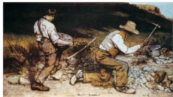
گوستاو کوربه، سنگ‌شکنان (۱۸۴۹)

به لحاظ موضوعی، یکی از برجسته‌ترین آثار، تابلو سال ۱۸۴۹ سنگ‌شکن‌های کوربه به دنبال انقلاب ۱۸۴۸ است. این تابلو تصویر دو کارگر معمولی را مشغول کار در تناسب و شیوه‌ای به تصویر می‌کشد که سابقاً متعلق به پادشاهان، ملکه‌ها و شخصیت‌های اساطیر یونان بود. اقدام دموکراتیکی دیگر، المپیا برهنه مانه در سال ۱۸۶۵ بود. از جهتی، المپیا به شکل سنتی بر به تصویر کشیدن زنی برهنه پایبند بود که قدمت آن به آثار بوتیچلی، تیسین و ولاسکز باز می‌گردد، اما تفاوت قابل توجهی با آن‌ها داشت. نقاشی مانه نه یک روسپی درباری که خود را به ونوس تغییر قیافه داده، بلکه یک دختر کارگر پارسی حومه‌نشین را به تصویر می‌کشید. به‌علاوه، او با حالتی شهوانی لب‌هایش را غنچه نکرده؛ بلکه با سردی به چشمان مخاطب خیره شده است. این تفاوت‌ها، خشم بورژواها و مورخان هنر را برانگیخت.