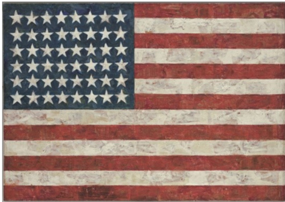
جسرپرانز، پرچم (۱۹۵۴)

اغلب دموکراتیزه کردن موضوع با تلاشی برای هنری کردن موضوعاتی که تاکنون به شکلی ذاتی هنر تلقی نمی‌شدند، شکل می‌گیرد. نقاشی‌های پرچم از جسرپرانز ۱ و رختخواب من از تریسی امین ۲ نمونه‌هایی از این دست هستند.