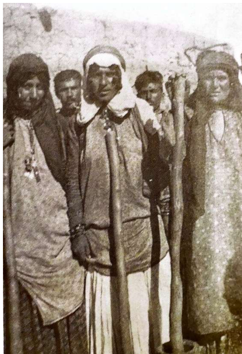
عکس شماره ۲ - لباس سنتی زنانه (پهلوی اول)