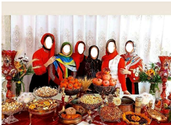
عکس شماره ۸- خودتزیینی مناسبتی