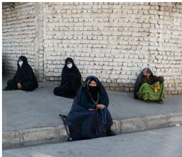
عکس شماره ۷- لباس اجتماع زنان کهنسال عرب کتی روستای حصار بالا (ماسک به علت شیوع بیماری کرونا مورد استفاده قرار گرفته‌است)

زن نباید تو روستا لباس تنگ و کوتاه بپوشد، زشته و گناه داره، حالا هرچی تو خونه‌اش می‌پوشد عیب نداره اما تو جمع باید رعایت کنه. ما که قدیم لباس خونه و بیرونمون یکی بود، لباس بلند و گشاد می‌پوشیدیم الانم رومون همیشه لباس تنگ بپوشیم. (مشارکت‌کننده ۳)