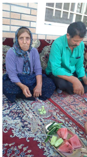
عکس شماره ۵- خودتزیینی فصل گرم و سرد