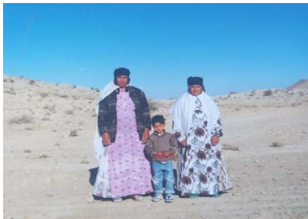
عکس شماره ۲- خودتزیینی سنتی طایفه عرب کُتی