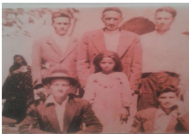
عکس شماره ۳- خودتزیینی روستایی طایفه عرب کُتی (اواخر دههٔ چهل)

ما از قدیم ظاعن (کوچرو) بودیم اما از وقتی اومدیم روستا و خانه خریدیم، دیگه یواش یواش لباس‌های بیلاق و قشقلاق رو کنار گذاشتیم. دیگه رومون نمی‌شد که لباس‌های اونجوری بپوشیم، دوست داشتیم مثل بقیه اهالی روستا لباس بپوشیم. (مشارکت‌کننده ۶) یکی از مصادیق اسنادی در مورد تغییر خودتزیینی کوچندگی به یکجانشینی روستایی را در قدیمی‌ترین عکس موجود در روستا می‌توان دید که در آن زنی با چادر و خودتزیینی روستایی در کنار مردان ایستاده است.