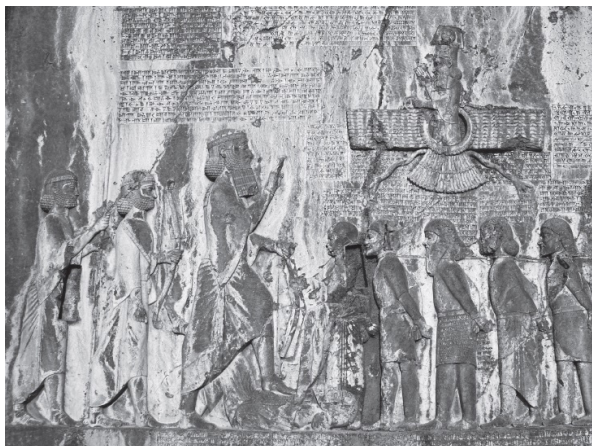
تصویر ۲- نقش برجسته داربوش نخست در بیستون.

روشن کرده‌اند و اضافه شدن ایزدی که در انتهای راست تصویر قرار گرفته، باعث تأکید بر جایگاه برتر «ایشتر» شده است. در عین حال، قرار داشتن حیوان منتسب به «ایشتر» یعنی «شیر» نیز باعث شده تا او نسبت به سایر کسانی که در تصویر هستند، مشخص‌تر باشد. ۸ در تصاویر میان دو رود باستان به کرات می‌توان چنین نقش‌مایه‌ای را مشاهده کرد. برای مثال، در بخش فوقانی استل مشهور حمورابی، حمورابی به حضور «شمش» می‌رسد و همان نشانه‌های مرسوم یعنی «میله» و «حلقه» را از «شمش» دریافت می‌کند (تصویر ۲). در اینجا نیز همانند نقاشی دیواری ماری، حمورابی در حالتی نقش شده است که حاکی از احترام و ستایش نسبت به «شمش» است. او دست راست خود را بالا آورده و در مقابل صورتش قرار داده و برخلاف نقاشی دیواری ماری، دست چپ را برای گرفتن «میله و حلقه» دراز نکرده است. در اینجا نیز نشانه‌های مهمی وجود دارند که «ایزد» را از «شاه» متمایز می‌کنند. علاوه بر حالت احترام‌آمیز حمورابی، کلاه شاخ‌دار «شمش»، ریش بلندتر و قرار گرفتن بر صندلی نیز می‌توانند نشانگر جایگاه برتر این ایزد نسبت به حمورابی قلمداد شوند.