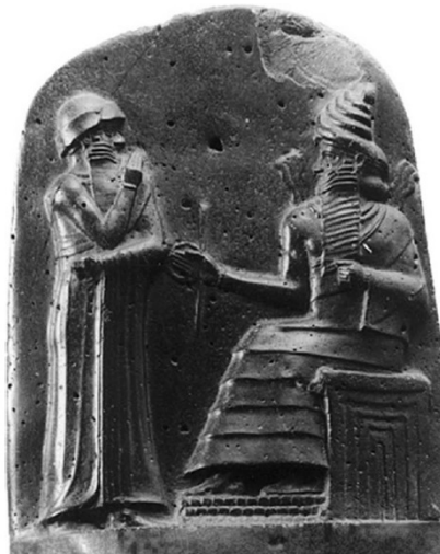
تصویر ۲- حمورابی ایستاده در مقابل شمش، قسمت فوقانی استل حمورابی.

سنگ‌نوشته‌ها و مدارک باقی مانده از دوره هخامنشی حاکی از آن هستند که مشروعیت سیاسی-اجتماعی شاه ناشی از انتخاب وی از سوی «اهورامزدا» بوده است. اما برخلاف نقش‌مایه‌های باقی مانده از میان دو رود باستان، هیچ‌یک از نقش برجسته‌های هخامنشی، صحنه انتصاب «شاه» از سوی اهورامزدا را نشان نمی‌دهند. در این دوره، با درکی عمیق‌تر از رابطه میان شاه و ایزد روبه‌رو هستیم. به نظر می‌رسد شاهان هخامنشی در نقش برجسته‌هایشان تمایلی به رویارویی مستقیم با اهورامزدا نداشتند و مقام و منزلت اهورامزدا را برتر از آن می‌دانستند که در کنار دیگر انسان‌ها تصویر شود. اگر پیکره‌ای را که از میان حلقه بالدار بیرون آمده و در بالای اکثر نقش برجسته‌های هخامنشی تهماسبی دارد، اهورامزدا به حساب آوریم؛ ۹ در آن صورت می‌توان چنین نتیجه گرفت که اهورامزدا بر فراز وقایع قرار دارد و همواره بر آنچه روی می‌دهد، نظارت مستقیم دارد. برای مثال می‌توان به نقش برجسته بیستون اشاره کرد که در آن اهورامزدا در قالب شخصی که از میان «حلقه بالدار» بیرون آمده، تصویر شده و در بالاترین