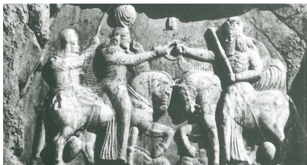
تصویر ۸- تاج‌ستانی اردشیر از هورامزدا در نقش رستم، مأخذ: (گیرشمن، ۱۳۹۰، ۱۳۲)