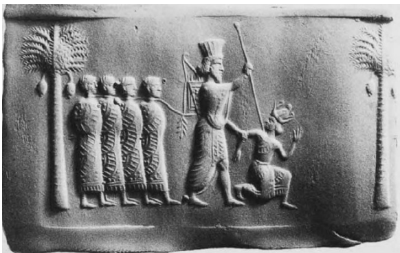
تصویر ۵- نقش مهر اردشیر سوم.

با این حال، روشن است که در دوره هخامنشی، شاهان این سلسله چنین ادعایی نداشتند و همواره خود را فرورتر از مقام «ایزدی» در نظر می‌گرفته‌اند. چنانکه پیش‌تر اشاره شد، داریوش همواره خود را مجری احکام و خواسته‌های اهورامزدا معرفی می‌کند و هر کاری را که انجام می‌دهد، بی‌واسطه آن را تحقق اراده الهی برمی‌شمرد. این در حالی است که پس از حمله اسکندر به ایران و باز میان رفتن تمدن هخامنشی و استیلای سلوکیان، ظاهراً نوعی از خدانگاری شاهان رواج می‌یابد. چنین فرهنگی، در دوره اشکانیان (۲۲۴ م- ۲۴۷ م) نیز استمرار می‌یابد و همچنان به