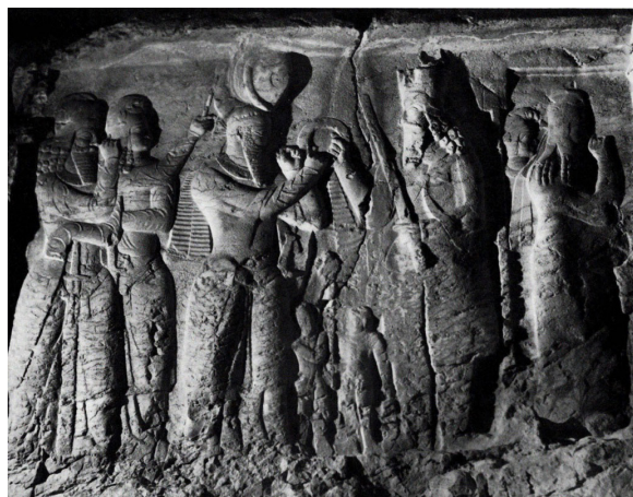
تصویر ۹- مواجهه اردشیر با هورامزدا.

چنانکه از این کتیبه به دست می‌آید، علاوه بر اینکه اردشیر خود را از «نژاد ایزدان» برمی‌شمارد، در کنار لقب «شاهنشاه» و «شاه» برای خود و پدرش، از عنوان «نخ» نیز استفاده می‌کند که به معنای «خدا» است. در عین حال، باید توجه داشت که عبارت «از نژاد خدایان» که در پهلوی به صورت «چپهر از یزدان» آمده، عبارتی پربسامد در دوره ساسانی است که نه تنها بر سکه‌های اردشیر، بلکه بر بسیاری از سکه‌های دیگر شاهان ساسانی نیز دیده می‌شود (دریایی، ۱۳۷۹، ۲۸). دریایی معتقد است که شاهان ساسانی حقیقتاً خود را از نطفه خدایان می‌دانسته‌اند و ممکن است اجتناب آن‌ها در عدم استفاده از این عنوان در سکه‌های خود که از دوره شاپور دوم به بعد اتفاق می‌افتد به سبب فشارهای روحانیان زرتشتی بوده باشد (دریایی، ۱۳۷۹، ۳۱). در عین حال، انتساب نسب شاهان ساسانی به کسی با نام «ساسان» که در متون مختلفی مانند کازنامه/ اردشیر بابکان ۲۷ ، دیده می‌شود نیز احتمالاً ترفندی در جهت القای همین باور بوده است. چه آنکه برخی پژوهشگران احتمال داده‌اند، «ساسان» نه انسان که «ایزد» می‌تواند در جمع ایزدان محلی یا درجه دوم بوده است. ۲۸ بدین ترتیب، می‌توان چنین نتیجه گرفت که در دوره ساسانی، انتساب شاهان این سلسله به «ساسان»، به معنای ایزد بودن خود شاهان تفسیر می‌شده و این شاهان می‌توانسته‌اند از این انتساب، در جهت مشروعیت بخشیدن به حکومت خود بهره برند.