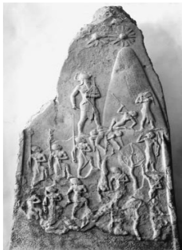
تصویر ۶- پیروزی نرام سین بر لولوبی‌ها. مأخذ: (Bahrani, 2001, 64)

علاوه بر ایجاد شهر جدید اردشیر خوره، پروژه دیگری نیز کلید خورد که با وضوحی بیشتر بیان‌کننده پادشاهی جدید بود. این پروژه جدید،