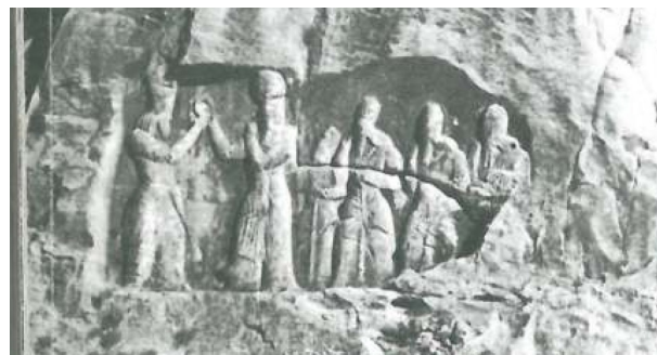
تصویر ۷- تاج‌ستانی اردشیر در تنگاب فیروزآباد، مأخذ: (گیرشمن، ۱۳۹۰، ۱۳۱)