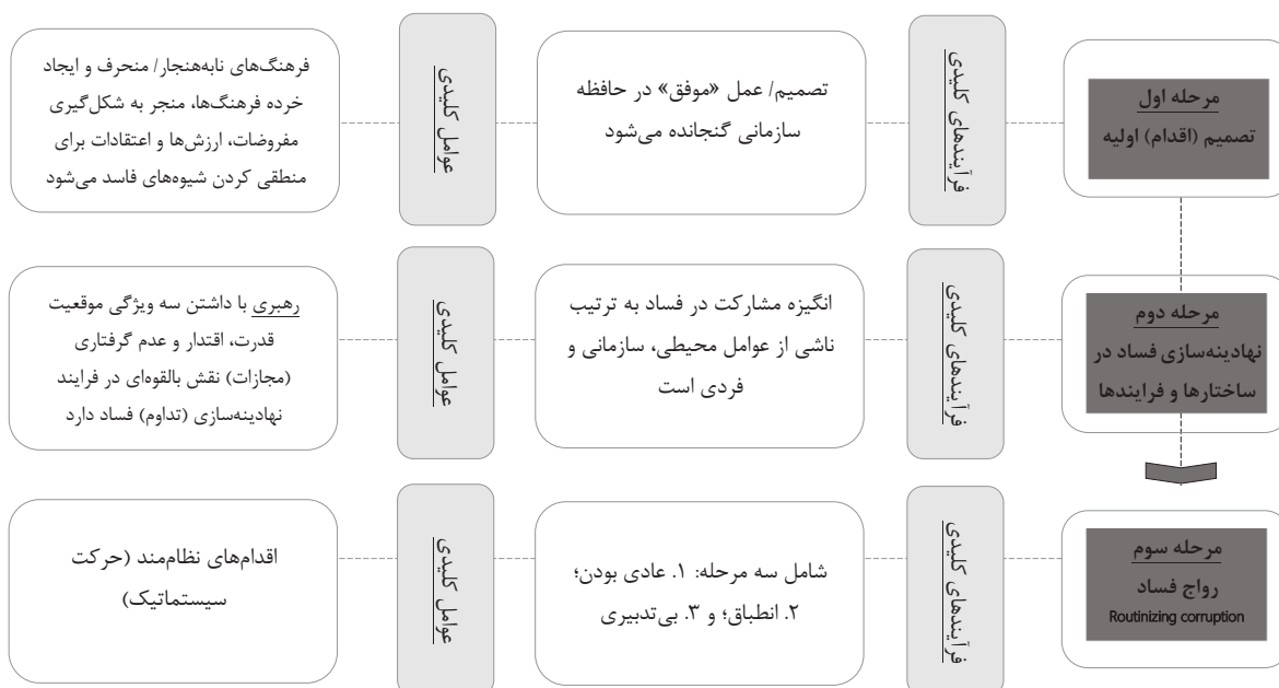
تصویر ۱ - تبیین مراحل سه‌گانه تسری فساد. مأخذ: (بر اساس Ashforth & Vikas, 2003)

به طور خاص، فساد نهادینه شده ۵ به این معنا است که اقدام‌ها، شیوه‌ها