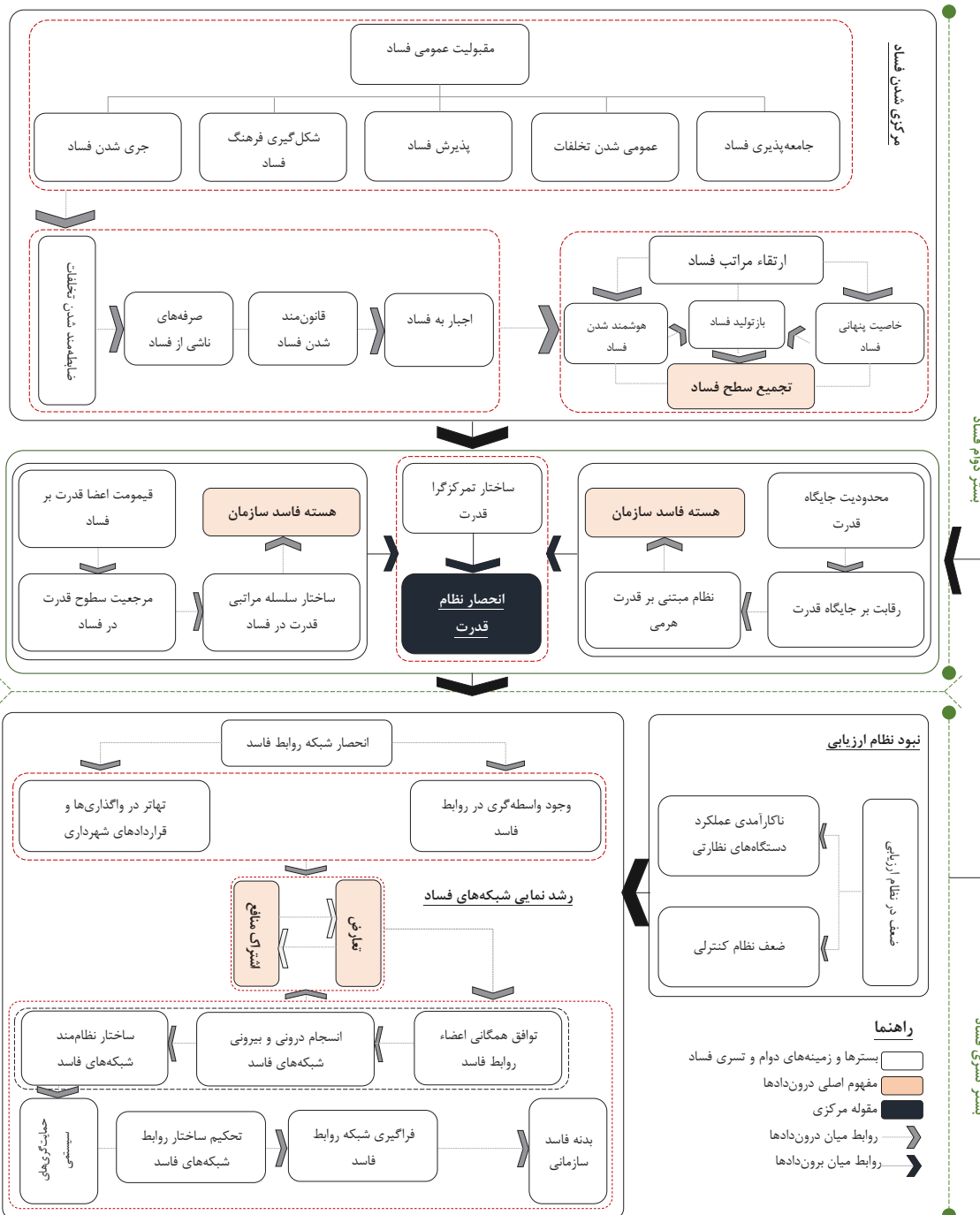
تصویر ۳- عوامل (ساختار/ زمینه‌های) مؤثر بر دوام و تسری فساد در شهرداری تهران.

روابط شبکه‌های فاسد می‌شود. سپس به دلیل «اشتراک منافع» و «حمایت‌گری‌های سیستمی»، شبکه روابط فاسد فراگیر می‌شود. منظور از اشتراک منافع، تقسیم سهم در روابط فاسد است، بخشی از این سهام را کارکنان شهرداری در برمی‌گیرند و بخش دیگر را سطوح قدرت. عموماً ارکان قدرت به دلیل اشتراک در اهداف سیاسی در دایره بزرگ‌تری از منافع شبکه قرار می‌گیرند، که آن را تحت عنوان منافع سیستمی در نظر می‌گیرند و منظور از حمایت‌گری‌های سیستمی همراهی و همدستی مافوق‌های سازمانی و فراسازمانی (ساختارهای فرادست) در پیشبرد اهداف شبکه‌های فاسد با یکدیگر و نیز هم‌راستاسازی و مناسب‌سازی