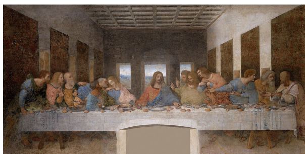
تصویر ۱۶. لئوناردو داوینچی، شام آخر ، ۱۴۹۵-۱۴۹۸، دیوارنگاره، ۴۶۰ × ۸۸۰ سانتی‌متر، کلیسای سانتا مارا یادله گرتزیه در میلان ایتالیا.

تا ببینند کدام یک از خواستگاران می‌تواند کمان اودیسه را خم کند. در نهایت از طریق این مسابقه او دوباره به همسر خود می‌رسد. نکته جالب توجه آن‌جاست که در نقاشی ببردن چهره همه شخصیت‌های انسانی به رنگ سیاه نقاشی شده و این یکی از روش‌هایی است که ببردن برای دفاع از حقوق آفریقایی-آمریکایی به کار برده است؛ او با جایگزین کردن شخصیت‌های سفید با سیاهان، سعی در زیر سؤال بردن نقش‌های تاریخی و کلیشه‌ای و آشکار کردن ظرفیت و توانایی‌های سیاهان دارد. یکی از نکات مهم این اقتباس آن است که آن‌چه اودیسه را اسطوره کرده، روایتی حماسی از تلاش بی‌پایان او برای بازگشت به خانه است؛ تلاشی که بارها توسط قدرت خدایان، قدرت دریاها، رخدادهای و تصمیمات اشتباه به شکست می‌انجامد اما او در نهایت پیروز این ماجراست. ببردن در ساخت این کلاژ به دنبال ایجاد پیوندی میان مبارزات اودیسه و مبارزات همه آمریکایی‌های آفریقایی تبار بود و از حماسه‌ای یونانی برای تأکید بر