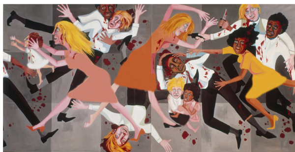
تصویر ۶. فیث رینگگلد، مجموعه مردم آمریکا، ۱۹۶۷، موزه هنر مدرن نیویورک. مأخذ: (URL6)