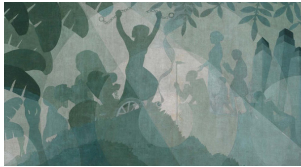
تصویر ۳. آرون داگلاس، هریت تابمن، ۱۹۳۱، نقاشی دیواری در کالج زنان بنت، ۱۸۲/۹ × ۱۳۷/۱ سانتی‌متر.

با گذر زمان و برپایی نمایشگاه‌هایی از هنرمندان غیرسفیدپوست در پاریس و لندن که پیش از این در انحصار نهادی سفیدپوستان قرار داشت ۲۴ ، نقدهای سیاسی و اجتماعی و وجه آشکارتری را در آثار هنری به نمایش گذاشتند. «بحث‌برانگیزترین هنرمند آفریقایی-آمریکایی دهه ۱۹۸۰، ژان میشل باسکیت ۲۵ است که در سال ۱۹۸۸ در سن ۲۷ سالگی درگذشت. او ریشه‌های پورتوریکویی ۲۶ داشت و از یک خانواده طبقه متوسط که هیچ پیوندی با فرهنگ و هنر آفریقایی آمریکایی نداشت، برخاسته بود. کارهای اولیه او دیوار نوشته‌هایی بود که در بسیاری از آثار معاصران نیویورکی او به‌وفور دیده می‌شود» (لوسی اسمیت، ۱۳۸۰، ۲۷۶). باسکیت در نقاشی‌های خود، از مفاهیم اجتماعی، به‌عنوان ابزاری برای حمله به ساختارهای قدرت و سیستم‌های نژادپرستی استفاده می‌کرد. آثار وی در انتقاد از استعمار و حمایت از مبارزه طبقاتی، کاملاً سیاسی بودند. او در اثری تحت نام بدون عنوان (تاریخ مردمان سیاه‌پوست) ۲۷ (یا نیل ) (۱۹۸۳) (تصویر ۵) از مصریان به‌عنوان مردمانی آفریقایی تبار یاد کرده و تفکر غربیان درباره مصر باستان به‌عنوان مهد تمدن غرب را زیر سؤال برده است. در مرکز نقاشی، یک قایق مصری، توسط اوزیریس ۲۸ ، خدای مصری، در رودخانه نیل در حال حرکت است. در سمت راست نقاشی، کلمات «Slave» و «Esclave» به معنای «برده» نوشته شده و کلماتی که