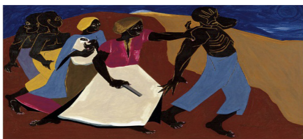
تصویر ۴. جاکوب لارنس، هریت تابمن، ۱۹۶۷، تمپرا روی پنبه، موزه هنر کارولینای شمالی.

لوئیس مایلو جونز ۲۸ از جمله زنان نقاش سیاه‌پوستی بود که در نیمه اول سده بیستم به فعالیت هنری پرداخت. نقاشی جونز تحت عنوان صعود اتیوپی ۲۹ (۱۹۳۲) (تصویر ۲) تصویری از مبارزه و پیشرفت آمریکایی‌های آفریقایی تبار در ایالات متحده، برای یافتن میراث و هویت خود در طول تاریخ است. محتوای نقاشی او، تکریم و بزرگداشت هویت سیاهان و نشان‌گر آن است که جریان رنسانس هارلم، به ایجاد یک هویت فرهنگی یکپارچه انجامیده است. جونز برای بیان محتوای مورد نظر خود، از چندین شگرد بهره گرفته است. به‌عنوان مثال، برای به تصویرکشیدن اتیوپی، از پیکره بزرگی که سرپوشی قومی بر سر دارد استفاده کرده تا اهمیت اتیوپی را به‌نمایش بگذارد. افرادی که به‌سوی شهر در حال حرکتند، نشان‌دهنده جامعه آفریقایی-آمریکایی و پیشرفت آن‌ها در طول زمان و نمادی از مبارزات سیاهان در طول زندگی است. در این نقاشی، رنگ‌های مورد استفاده به‌غیر از آبی و سیاه، رنگ زرد است که