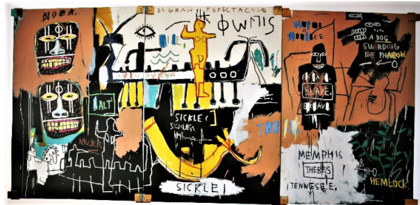
تصویر ۵. ژان میشل باسکیت، بدون عنوان: تاریخ مردمان سیاه پوست، (نیل)، ۱۹۸۳، اکریلیک و مداد رنگی روی بوم، ۱۷۲/۵ × ۳۵۸ سانتی متر.