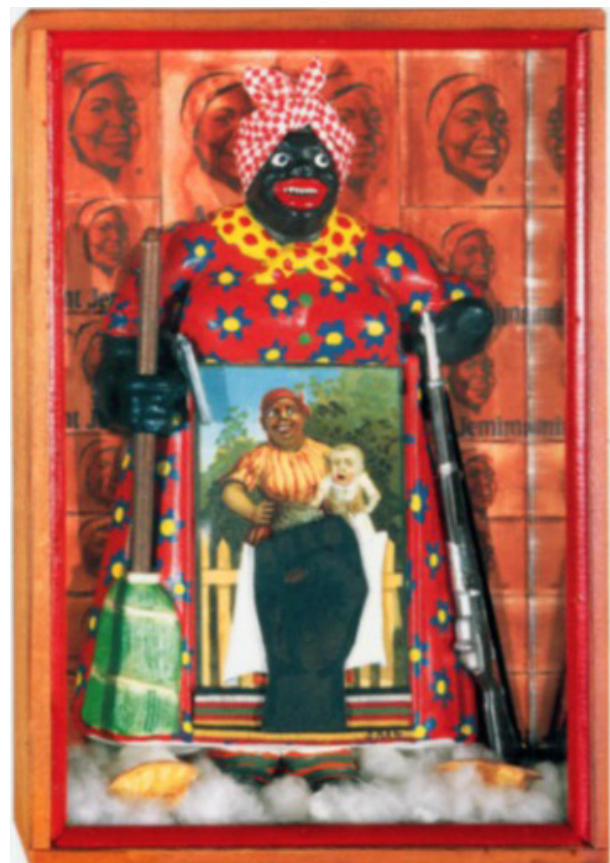
تصویر ۷. بتی سار، آزادی عمه جمیما ، ۱۹۷۲.

نقاشی رنسانس تا هنر عامیانه سیاه را شامل می‌شود؛ آثاری که به هدف بازبینی و رفع «خلا موجود در بانک تصاویر» نقش می‌شوند تا آنچه را که ناپیداست، حاضر و قابل مشاهده سازند. او در اثری تحت عنوان تائید شد، زیباست ۱۲ (۱۹۹۳) با الهام از کلاس تشریح دکتر نیکولاس تولپ ۱۳ (۱۶۳۲) اثر رامبرانت ۱۴ ، به تجسم جسد یک زن سیاه‌پوست قرار گرفته بر میز تشریح پرداخته است. در این نقاشی یک زن با رنگ سیاه اغراق شده، روی میز معاینه قرار دارد و پوست یکی از دستان او جدا شده است. در اطراف بدن زن نقوشی محو از گل، کلمات و نمودارهای یک آزمایشگاه آناتومی، نموداری از سیستم عصبی انسان، نمایی از یک خانه و قاب‌هایی مصور به چهره سه رنگین‌پوست با هاله‌ای مقدس در اطراف سر، قرار دارد. مارشال در این اثر نشان می‌دهد که نه فقط بدن سیاه‌پوستان، بلکه