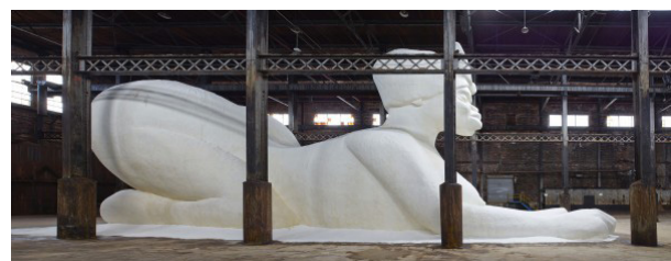
تصویر ۸. کارا واکر، لطیف ، ۲۰۱۴، کارخانه شکر بروکلین.