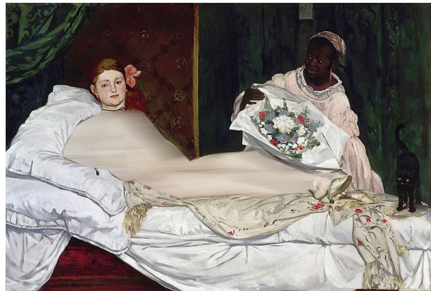
تصویر ۱۰. ادوار مانه، المپیا، ۱۸۶۳، رنگ روغن روی بوم، ۱۳۰/۵ × ۹۰ سانتی متر، موزه اورسی پاریس.

رومیر بیردن ۶۲ نقاش، کارکاتوریست و هنرمند کلاژکار آمریکایی-آفریقایی است که زندگی و فرهنگ آفریقایی-آمریکایی را در رسانه‌های مختلف هنری به تصویر کشیده است. بازگشت ادیسه ۶۳ (۱۹۷۷) (تصویر ۱۳) نمونه‌ای از تلاش او برای دفاع از حقوق نژاد آمریکایی-آفریقایی تبار، با رویکردی به هنر کلاژ و اقتباس در شیوه «انتقال» است. این اثر، بازخوانش یک شاهکار ادبی و از آن خود سازی یک اثر هنری با عنوان بازگشت ادیسه اثر پینتورچیو ۶۴ نقاش ایتالیایی سده پانزدهم و شانزدهم میلادی است (تصویر ۱۴). این نقاشی نمایش‌گر یکی از صحنه‌های ادیسه حماسه هومر است که در آن ادیسه قهرمان سرانجام از سفری طولانی به خانه بازمی‌گردد و متوجه می‌شود که با تصور کشته شدن او، خواستگاران تلاش می‌کنند پنه‌لویه، همسرش را از آن خود کنند. ادیسه که در لباس یک فقیر ظاهر شده، پنه‌لویه را متقاعد می‌کند که باید مسابقه‌ای برگزار کند