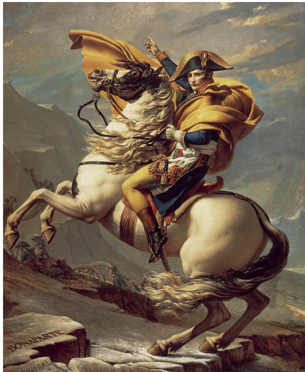
تصویر ۱۸. ژاک لویی داوید، ناپلئون در حال عبور از آلپ، ۱۸۰۱، رنگ روغن روی بوم، ۲۲۱×۲۶۱ سانتی متر، کاخ شاتودوما لمیسون فرانسه

نیست و بر خلاف موهای بلند و موج و طلائی ونوس، موهای کوتاه سیاهی دارد. این الهه ثابت می‌کند که زیبایی تعریف بی‌نهایتی دارد و زنان سیاه‌پوست بر خلاف نقاشی‌های سنتی که آن‌ها را به‌عنوان خدمتکار یا شخصیت‌های جانبی نشان می‌دهند، می‌توانند در مرکز توجه باشند. در سمت چپ تصویر به جای زن و مرد اساطیری نقاشی بوتیچلی، دو