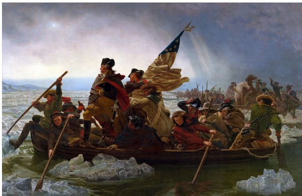
تصویر ۱۲. امانوئل لوتز، واشینگتن در حال عبور از دلاویر، ۱۸۵۱، رنگ روغن روی بوم، ۳۷۸/۷ × ۶۴۷/۷ سانتی متر، موزه متروپولیتن.

به افشای شکاف‌های نژادی ساختار سیاسی آمریکا پرداخته و تصویر کلیشه‌ای مردم آفریقایی آمریکایی را در تاریخ آمریکا به نمایش می‌گذارد. هنرمند در این اثر با خلق «تفسیری» متفاوت، با استفاده از فرم‌های متحرک و رنگ‌های پر زرق و برق، تنش‌های نژادی رایج در جامعه آمریکا را به تصویر کشیده و از طنزی شناخته شده برای درگیر کردن ذهن بینندگان استفاده کرده است.