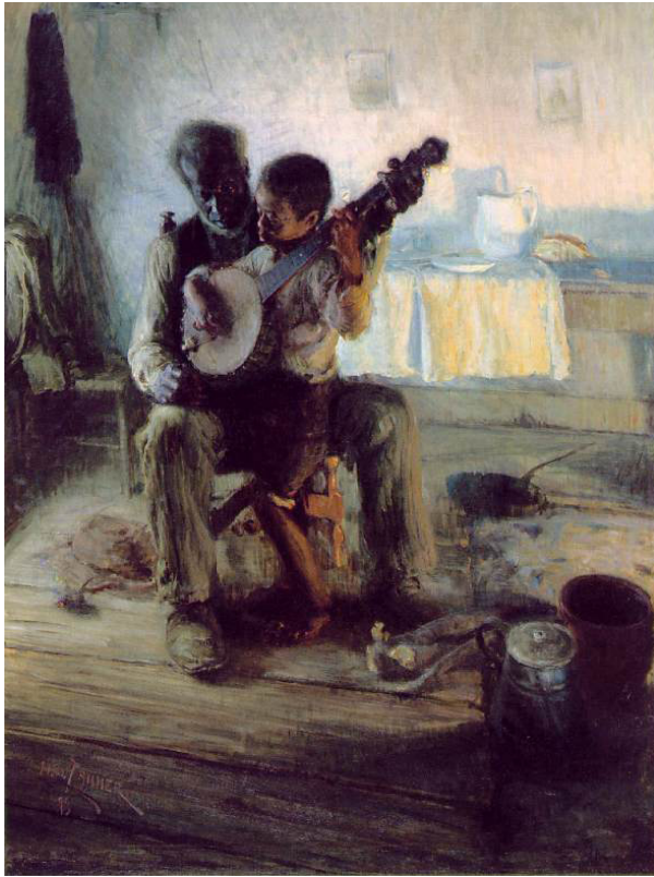
تصویر ۱. هنری اوساوا تانر، کلاس درس بانجو، ۱۸۹۳، رنگ روغن روی بوم، ۹۰/۴ × ۱۲۴ سانتی متر، موزه همپتون ویرجینیا.