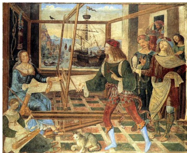
تصویر ۱۴. بازگشت اودیسه، پینتور پیچو، ۱۵۰۸-۱۵۰۹، فرسک منتقل شده بر بوم، ۱۲۴ × ۱۴۶ سانتی‌متر، گالری ملی لندن. مأخذ: (URL14)