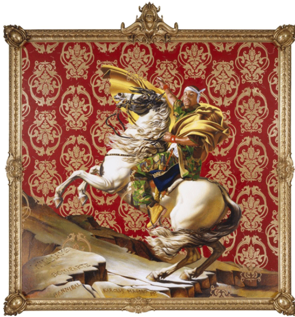
تصویر ۱۷. کیهاند ویلی، ناپلئون در حال عبور از آلپ، ۲۰۰۵، رنگ روغن روی بوم، ۲۷۴×۲۷۴ سانتی متر، موزه بروکلین