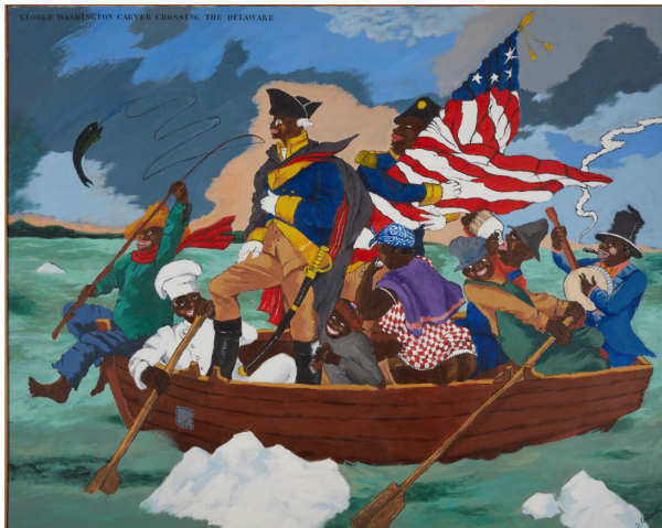
تصویر ۱۱. جرج واشینگتن در حال عبور از دلاویر: برگه از یک کتاب درسی آمریکا، ۱۹۷۵، رنگ روغن روی بوم، ۱۹۹/۴ × ۲۴۹/۶ سانتی متر، مجموعه خصوصی.