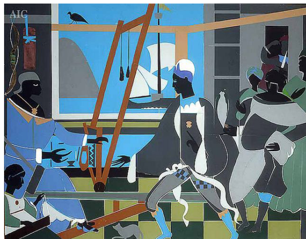
تصویر ۱۳. رومی بوردن، بازگشت اودیسه ، ۱۹۷۷، ۱۱۱/۸ × ۱۴۲/۲ سانتی‌متر، مجموعه خصوصی.

تا ببینند کدام یک از خواستگاران می‌تواند کمان اودیسه را خم کند. در نهایت از طریق این مسابقه او دوباره به همسر خود می‌رسد. نکته جالب توجه آن‌جاست که در نقاشی ببردن چهره همه شخصیت‌های انسانی به رنگ سیاه نقاشی شده و این یکی از روش‌هایی است که ببردن برای دفاع از حقوق آفریقایی-آمریکایی به کار برده است؛ او با جایگزین کردن شخصیت‌های سفید با سیاهان، سعی در زیر سؤال بردن نقش‌های تاریخی و کلیشه‌ای و آشکار کردن ظرفیت و توانایی‌های سیاهان دارد. یکی از نکات مهم این اقتباس آن است که آن‌چه اودیسه را اسطوره کرده، روایتی حماسی از تلاش بی‌پایان او برای بازگشت به خانه است؛ تلاشی که بارها توسط قدرت خدایان، قدرت دریاها، رخدادهای و تصمیمات اشتباه به شکست می‌انجامد اما او در نهایت پیروز این ماجراست. ببردن در ساخت این کلاژ به دنبال ایجاد پیوندی میان مبارزات اودیسه و مبارزات همه آمریکایی‌های آفریقایی تبار بود و از حماسه‌ای یونانی برای تأکید بر