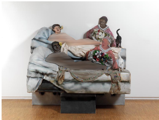
تصویر ۹. لری ریورز، من المپیا را در چهره سیاه دوست دارم ، ۱۹۷۰، چوب و پلاستیک و پلاکسی گلاس، ۱۸۲ × ۱۹۴ × ۱۰۰ سانتی‌متر، موزه ملی هنر مدرن پمپیدو پاریس.

نقاشی رنسانس تا هنر عامیانه سیاه را شامل می‌شود؛ آثاری که به هدف بازبینی و رفع «خلا موجود در بانک تصاویر» نقش می‌شوند تا آنچه را که ناپیداست، حاضر و قابل مشاهده سازند. او در اثری تحت عنوان تائید شد، زیباست ۱۲ (۱۹۹۳) با الهام از کلاس تشریح دکتر نیکولاس تولپ ۱۳ (۱۶۳۲) اثر رامبرانت ۱۴ ، به تجسم جسد یک زن سیاه‌پوست قرار گرفته بر میز تشریح پرداخته است. در این نقاشی یک زن با رنگ سیاه اغراق شده، روی میز معاینه قرار دارد و پوست یکی از دستان او جدا شده است. در اطراف بدن زن نقوشی محو از گل، کلمات و نمودارهای یک آزمایشگاه آناتومی، نموداری از سیستم عصبی انسان، نمایی از یک خانه و قاب‌هایی مصور به چهره سه رنگین‌پوست با هاله‌ای مقدس در اطراف سر، قرار دارد. مارشال در این اثر نشان می‌دهد که نه فقط بدن سیاه‌پوستان، بلکه