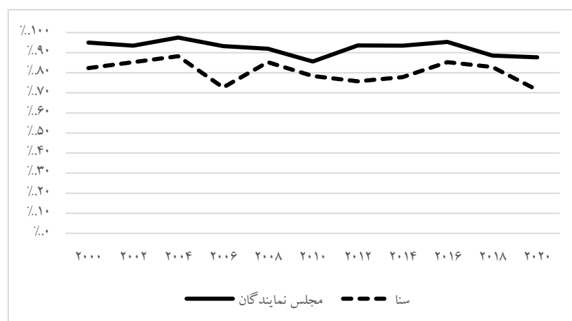
شکل ۱. درصد پیروزی نامزدهای با هزینه‌های بیشتر در انتخابات کنگره آمریکا از سال ۲۰۰۰ تا ۲۰۲۰ برگرفته از سایت Open Secrets و بر اساس داده‌های کمیسیون فدرال انتخابات آمریکا (OpenSecrets, 2020).

امروزه پول و منابع مالی نقشی بی‌بدیل در فرایندهای سیاسی و به خصوص انتخابات‌ها دارند و به این مسئله از زوایای مختلفی پرداخته می‌شود. در میان پژوهشگران این موضوع مورد اجماع است که هر چند نقش مخارج و هزینه‌های مالی از جایی به بعد در تعیین نتایج انتخابات‌ها کاهنده و کم‌رنگ می‌شود، اما حتی سیاست‌مداران مستقر نیز بدون دسترسی به پول نمی‌توانند به برنده شدن در انتخابات امیدوار باشند (Fisher & Eisenstadt, 2004, p. 1). داده‌های موجود درباره هزینه‌های نامزدهای انتخابات کنگره در آمریکا نیز به این موضوع اشاره دارد که احتمال پیروزی نامزد با هزینه انتخاباتی بیشتر بسیار بالاتر است (شکل ۱). اما آیا این موضوع نامطلوب بوده و نشان‌دهنده نقش مخرب پول در فرایندهای سیاسی است؟