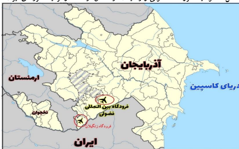
شکل ۳: موقعیت فرودگاه فضولی و زنگیلان در مناطق آزادشده و نزدیک مرزهای ایران

زنگلان در سال ۲۰۲۲ کامل شد. فرودگاه لاجین نیز در بهار ۲۰۲۴ تکمیل خواهد شد (Nakanishi, 2023: 33).