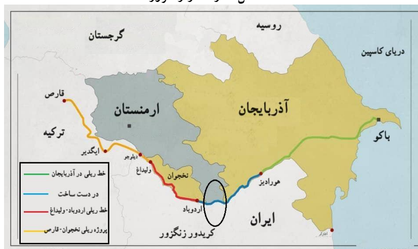
شکل ۴: راه‌گذر زنگزور

روندهای ژئوپلیتیکی در جنگ دوم قره‌باغ است که می‌تواند پیامدهای ژئوپلیتیکی نیز در آینده به‌همراه داشته باشد.