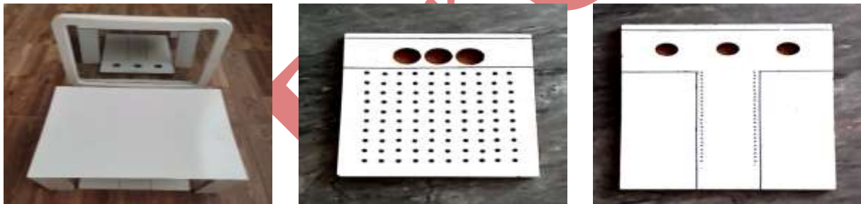
شکل ۱: تست های تخته میخ پر دو، چابکی اوکانر و تخته میخ پر دو در آینه

در این پژوهش سه نوع تکلیف مهارت انگشتی شامل تست تخته میخ پر دو، تست چابکی اوکانر و تست تخته میخ پر دو در آینه به کار گرفته شد (شکل ۱)، که این ابزارها در پژوهش برگر، کرول و دانن (۲۰۰۹)، کیجل و همکاران (۲۰۱۷) استفاده شده است. تست تخته میخ پر دو، صفحه تخته میخ شامل دو ردیف ۲۵ تایی با ستون های موازی که به صورت عمودی سازماندهی شده است. در هر سوراخ یک میخ و در مجموع ۵۰ عدد میخ را باید در دو ردیف جایگذاری کرد و زمان انجام این تست توسط کرنومتر ثبت می شود. ابزار مورد استفاده در تست چابکی اوکانر شامل یک تخته است که از ۱۰ ردیف سوراخ تشکیل شده که آزمودنی ها باید با قرار دادن سه میخ در هر سوراخ سه ردیف اول را تکمیل کنند، در هر ردیف ۳۰ میخ و در مجموع ۹۰ میخ را جایگذاری و زمان انجام این تست نیز توسط کرنومتر ثبت می گردد. در تست تخته میخ پر دو در آینه، ابزار مورد استفاده یک صفحه تخته میخ شامل دو ردیف ۲۵ تایی با ستون های موازی است (مشابه با تست تخته میخ پر دو) که به صورت عمودی قرار گرفته اند. و یک مانع که به منظور جلوگیری از دید مستقیم روی تخته قرار گرفته و همچنین آینه که مقابل مانع و تخته قرار گرفته است. آزمودنی ها پشت میز قرار گرفته و با نگاه کردن در آینه ۵۰ میخ را در دو ردیف جایگذاری و زمان انجام آن هم توسط کرنومتر ثبت می شود.