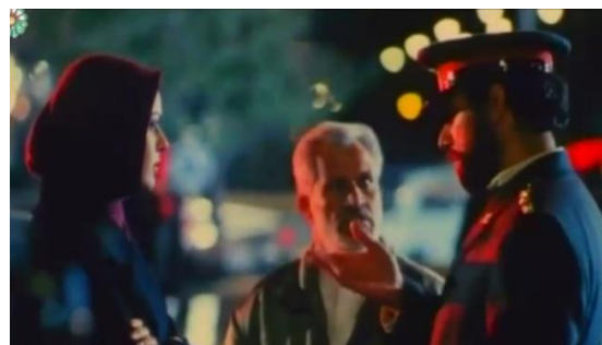
تصویر ۹) مواخذه پرستو حین شبگردی با پیمان توسط مأموران