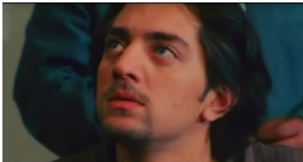
تصویر ۱۲) زاویه نگاه پیمان به مأمور اداره اجتماعی پلیس