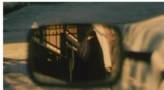
تصویر ۲۰) دیده‌بانی و مراقبت پلیس بر آمدو شد خانه پرستو

در ادامه فیلم و پس از آنکه پیمان موفق به فرار از دست مأموران انتظامی می‌شود، دیالوگی بین سیف‌الاسلام و حاج‌فتح شکل می‌گیرد که از بن‌مایه‌های ایدئولوژیک برخوردار است.