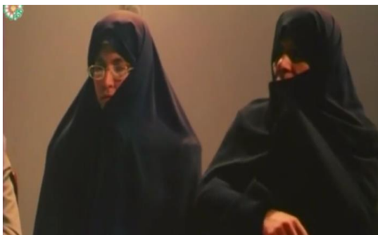
تصویر ۳) اعضای کمیته انضباطی دانشگاه با چادر و پوشش کامل