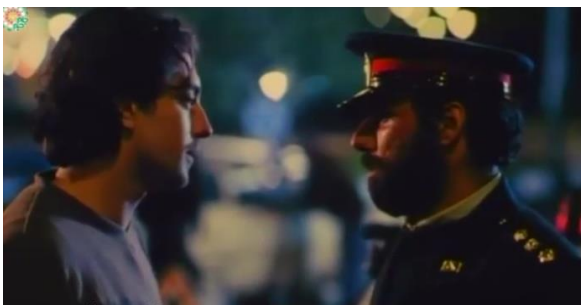
تصویر ۱۰) مواخذه پیمان از سوی مأمور ایست بازرسی حین شبگردی با پرستو

تناقض گفته‌های پیمان و پرستو، باعث سوءظن پلیس و بازداشت و تحویل آن دو به اداره اجتماعی پلیس می‌شود که این موضوع، مخالفت و مقاومت پرستو را در پی دارد. او در اعتراض می‌گوید: «مملکت قانون دارد. هرکی به هرکی نمی‌شود.» می‌توان این گفته پرستو را نوعی ارجاع به نظریه جورجو آگامبن ذیل مفهوم «شرایط استثنایی» قلمداد نمود. آگامبن می‌گوید: «در شرایط استثنایی، موقتاً قانون تعلیق می‌شود و نظر حاکم جای قانون را می‌گیرد. در این شرایط بدن حالت عریانی پیدا می‌کند برای اعمال قدرت حاکم.»