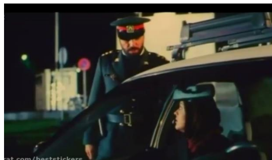
تصویر ۱۸) پلیس در حال مواخذه پرستو به ظن شبگردی با پیمان