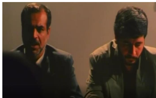
تصویر ۲) اعضای کمیته انضباطی دانشگاه با ریش و محاسن

در ادامه فیلم که پیمان و پرستو در اداره اجتماعی پلیس بازداشت می‌شوند، دو افسر پلیس با نام‌های حاج‌فتح و سیف‌السلام حضور دارند. آنان هردو دارای اسامی مذهبی بوده و دارای ریش و محاسن و بدنی هنجارمند و منطبق با گفتمان اصول‌گرایانه هستند. بنابراین به لحاظ رمزگان اجتماعی، می‌توان تعلق هر کدام از شخصیت‌های فیلم را به گفتمان خاصی نسبت داد.