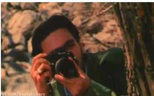
تصویر ۱۹) دیده‌بانی کارمند کمیته انضباطی دانشگاه حین جشن تولد

همانگونه که اشاره شد این دیالوگ اخیر حاج‌فتح اشاره به ویژگی مشاهده‌گری و نظارت دائمی قدرت بر سوژه‌ها در یک جامعه انضباطی دارد. نظارتی که همواره و بی‌وقفه بر سوژه‌ها اعمال می‌شود. کارگردان برای تأکید بر این ویژگی، به شکلی مکرر، صحنه‌هایی از خودروهای انتظامی با چراغ‌های گردان، مأموران انتظامی، ایست بازرسی‌های متعدد، بازداشتگاه و میله‌های اتاق‌های بازداشت و غیره را به نمایش می‌گذارد که همگی نشانگانی از دیده‌بانی مشرف به صحنه و حضور همیشگی و همه‌جایی قدرت را با خود به همراه دارند.