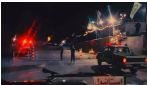
تصویر ۲۱) حضور پررنگ پلیس و خودروهای انتظامی