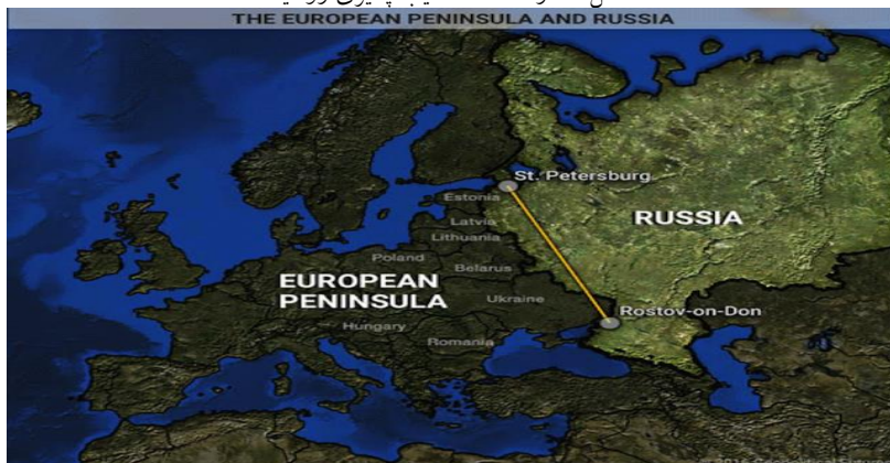
شکل شماره ۱: خط آسیب‌پذیری روسیه

تیم مارشال مدعی است که باید از دشواری‌های بزرگ دسترسی به دریاهای آزاد یاد کنیم. در صورت بروز جنگ، نیروی دریایی روسیه به دلیل وجود تنگه اسکاگراک در مسیر دریای شمال، نمی‌تواند از دریای بالتیک خارج شود و سواستوپول در کریمه که تنها بندر گرم روسیه است، در پانصد سال گذشته بارها از سمت غرب مورد هجوم واقع شده است. در سال ۱۶۰۵ لهستانی‌ها، در ۱۷۰۸ سوئدی‌ها، در ۱۸۱۲ فرانسویان، آلمان در ۱۹۱۴ و ۱۹۴۱ به آن یورش برده‌اند. با در نظر گرفتن جنگ کریمه ۱۸۵۳-۱۸۵۶ و دو جنگ جهانی، روس‌ها در هر ۳۳ سال یک‌بار در جلگه اروپای شمالی و اطرافش جنگیده‌اند (Marshal, 2020: 18). نقشه زیر آسیب‌پذیری‌های جغرافیایی روسیه را، در دشت‌های باز به روی اروپا و ناتو از سن پترزبورگ در کنار دریای بالتیک تا روستف در کنار دریای آرف نشان می‌دهد.