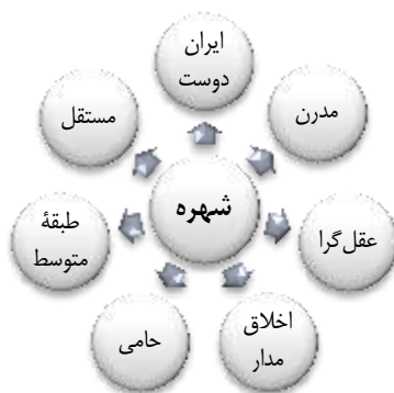
نمودار ۲. ویژگی هویتی شهره

شهره حامی مرکزی داستان است. بیشتر زن‌های گرفتار و طردشده اجتماع به وی ختم می‌شوند: پیرزن همسایه، کمک کردن به همکلاسی قدیمی‌اش، محبوبه دخترخاله‌اش و خواهرش.