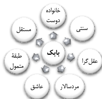
نمودار ۳. ویژگی هویتی بابک

می‌کند، بسیار خشمگین می‌شود و برای انتقام تا مدت‌ها همسر شهره را آزار می‌دهد. در نهایت، همسرش را طلاق می‌دهد و دوباره به سراغ شهره می‌آید و می‌خواهد او را به ازدواج ترغیب کند.