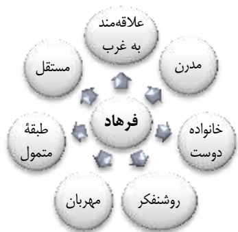
نمودار ۴. ویژگی هویتی فرهاد

شخصیت فرهاد: در میانه داستان ظهور می‌کند و تا پایان داستان ادامه دارد. کیف مدارک فرهاد در تاکسی شهره جا می‌ماند. شهره تصمیم می‌گیرد آن را به صاحبش بدهد و این شروع یک آشنایی جدید است. فرهاد، اخلاق و رفتاری اروپایی دارد و برای زنان جامعه ارزش قائل می‌شود.