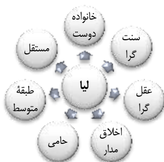
نمودار ۵. ویژگی هویتی لیا

می‌کند همسری خوب باشد، اما همسرش، علا، این زنانگی را نمی‌بیند: «اصلاً مرا نمی‌بیند. داد می‌کشد. مرا نمی‌بیند که هنوز کشیده‌ام و رعنا...» (Amirkhani, 2016: 85).