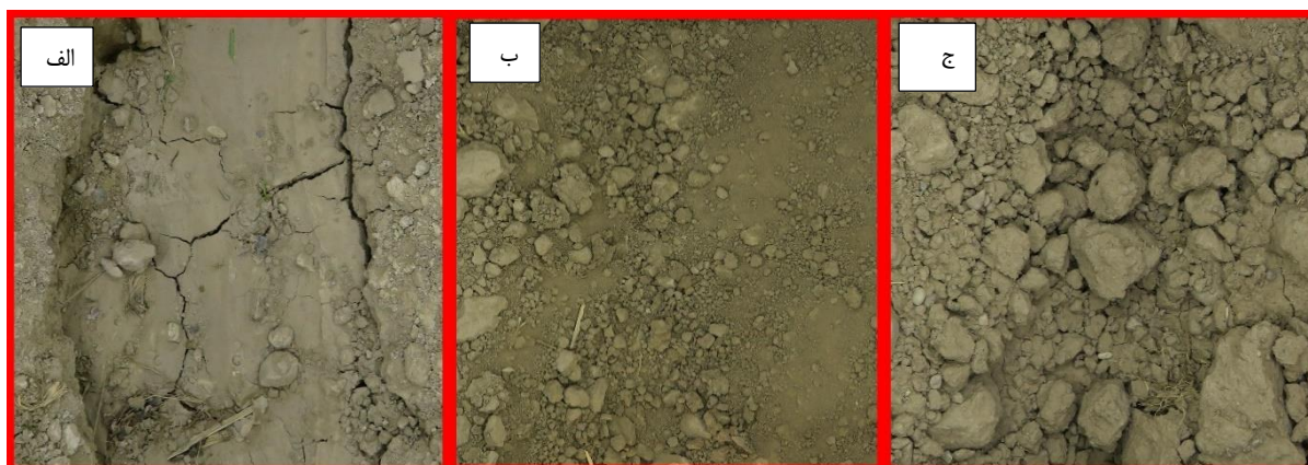
شکل ۱. نمونه‌ای از تصاویر استفاده‌شده برای تعیین شاخص اندازه و تعداد کلوخه‌ها قبل از آبیاری (الف: کلوخه زیاد، ب: کلوخه متوسط، ج: کلوخه کم)

برای بررسی دقت رابطه بین پارامترهای مختلف و ضریب زبری مانینگ در فازهای مختلف، کلیه داده‌ها به دو بخش آموزش و آزمون تقسیم شدند. بدین منظور ۸۰ درصد از داده‌ها برای آموزش و ۲۰ درصد برای آزمون مورد استفاده قرار گرفتند سپس با بررسی شاخص‌های آماری R^2 ، RMSE و NRMSE در داده‌های آموزش و آزمون بهترین معادلات در فازهای پیشروی، ذخیره و کل رخداد آبیاری استخراج شد.