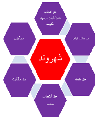
شکل ۲. پارادایم یا الگوی نظری دوره مدرن؛ شهروندی- دولت

بنابراین می‌توان گفت که همزمان با شکل‌گیری حکومت‌های مردمی و تعریف انسان‌ها به‌عنوان شهروندانی که در همه حوزه‌ها صاحب حق هستند و حکومتی نیز مشروع است که بر پایه خواست مردم باشد، شاهد روی کار آمدن پارادایمی با عنوان «شهروند- دولت» هستیم که در آن مردم از آزادی کاملی برای انتقاد و شیوه‌های مختلف اعتراض و مشارکت و بیان خواسته‌هایشان حتی به شکل رادیکال و براندازانه در مقابل دولت برخوردارند و دولت نیز موظف به حفاظت از حقوق و کمال افراد و ابتنا به خواست شهروندان است.