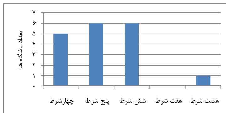
شکل ۴. تعداد شرط‌ها و تعداد باشگاه‌هایی که آنها را برآورده کرده‌اند

بررسی جدول ۵ نشان می‌دهد که بیشترین شرایط را برای ورود به بازار بورس، باشگاه سایپا با ۸ مورد و کمترین را باشگاه‌های استقلال، فجر سپاسی، شهرداری تبریز، فولاد خوزستان و ملوان انزلی با ۴ مورد دارا هستند.