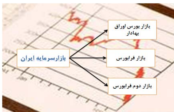
شکل ۱. بازارهای مختلف بازار سرمایه ایران

بازار سرمایه ایران شامل دو بازار اصلی بورس و بازار فرابورس است که بازار فرابورس با شرایطی آسان‌تر برای ورود شرکت‌ها در نظر گرفته شده است. فرابورس نیز دارای دو بازار به نام بازار اول و بازار دوم است. در این دو بازار نیز، بازار دوم شرایط سهل‌تری را برای ورود داراست.